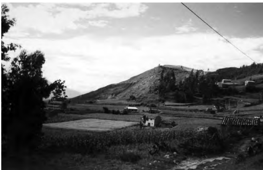
Figura N.º 1. Anexo Queral de la C.C. Cruz de Mayo.