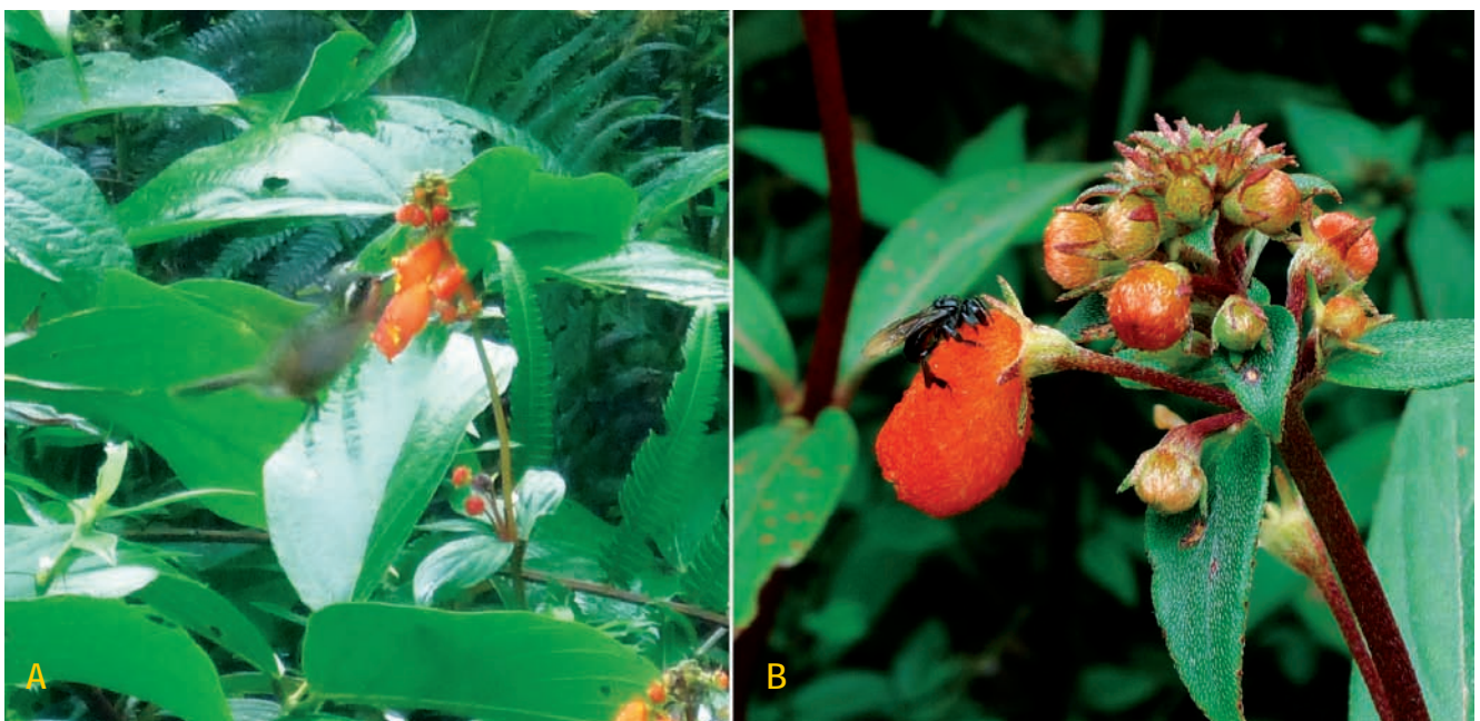
Figura 3. Visitadores en Seemannia sylvatica . A) Adelomyia melanogenys (Trochilidae) alimentándose del néctar de una flor de S. sylvatica . B) Abeja Meliponini (Apidae) robando néctar a partir de un orificio en la base de la corola de S. sylvatica .