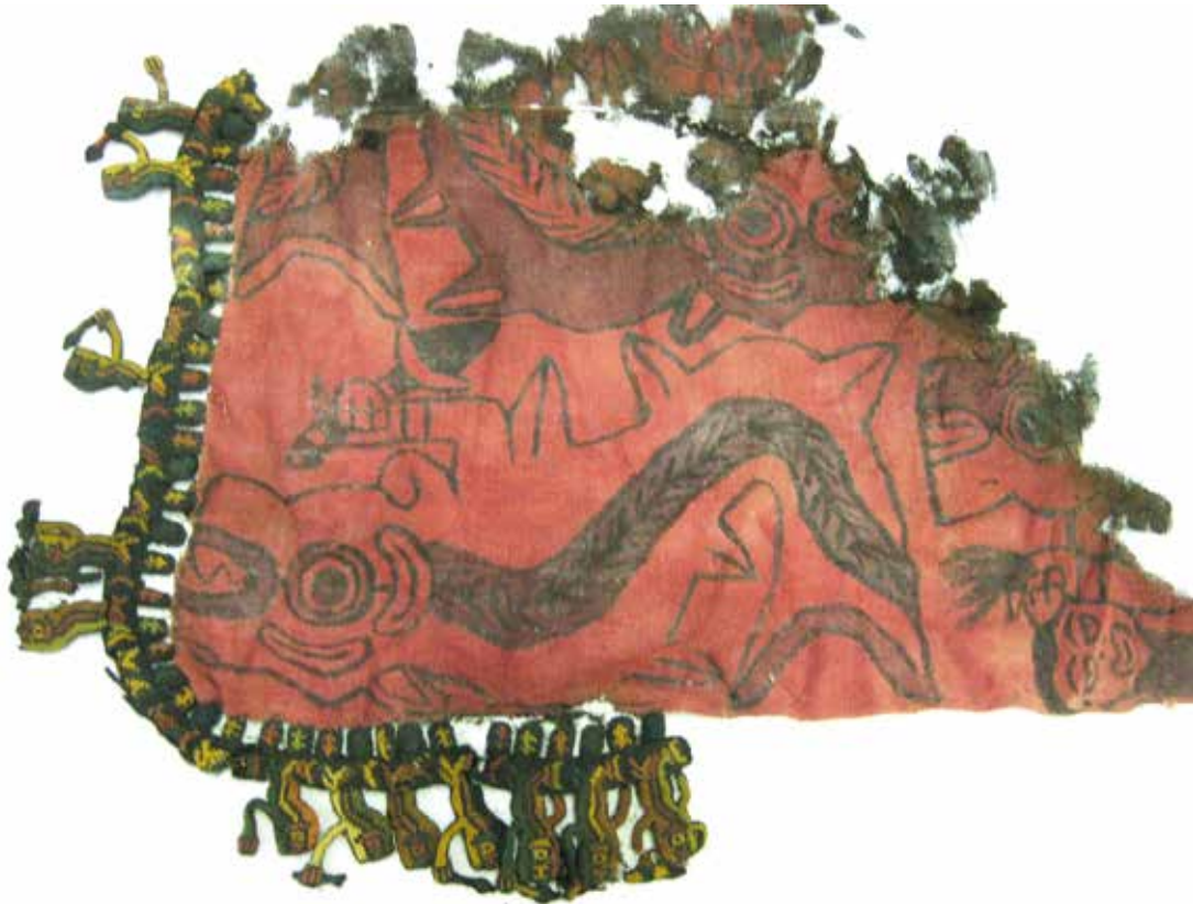
Foto 4. Textil T209, imágenes de "orcas" portando cuchillo y cabeza humana cortada.