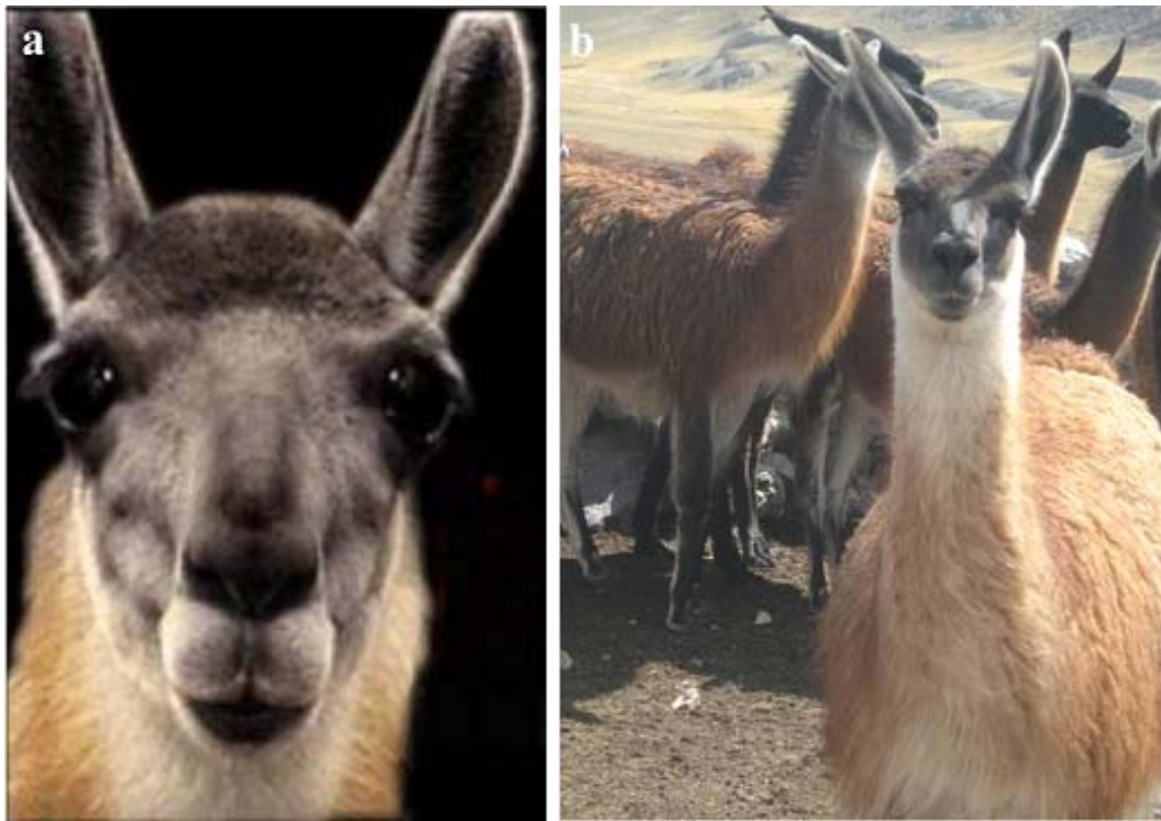
Figura 3. Fotografías de camélidos sudamericanos. (a) Cara de un guanaco andino peruano ( Lama guanicoe cacsilensis ); (b) Grupo de llamas ( Lama glama ) de Marcapomacocha