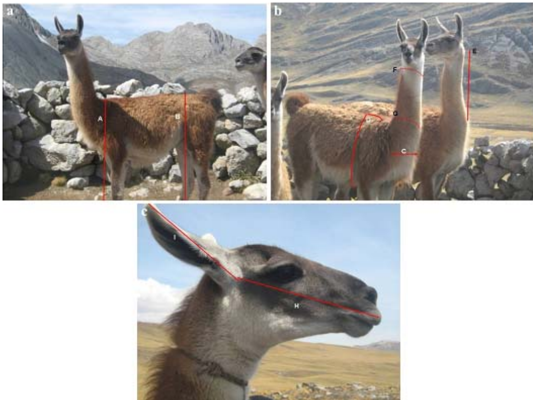
Figura 1. Fotografías de llamas que ilustran el esquema empleado para la obtención de las medidas biométricas. Foto A: (a) Altura a la cruz; (b) Altura a la grupa. Foto B: (c) Ancho del pecho; (d) Perímetro torácico; (e) Largo del cuello; (f) Perímetro superior del cuello; (g) Perímetro inferior del cuello. Foto C: (h) Largo de la cara; (i) Largo de la oreja

Se colectó 2 ml de sangre por punción yugular de cada animal, utilizando tubos al vacío (Vacutainer®) con EDTA. Las muestras fueron conservadas a -20 °C. La extracción y análisis de ADN se realizó en la Unidad de Genética y Virología Molecular de la Facultad de Medicina Veterinaria, Universidad Nacional Mayor de San Marcos. La extracción de ADN fue realizado según lo descrito por Sambrook et al. (1989), utilizando la solución tampón QLB (Queen's Lysis Buffer) y Proteinasa K, incubándolos por 24 horas