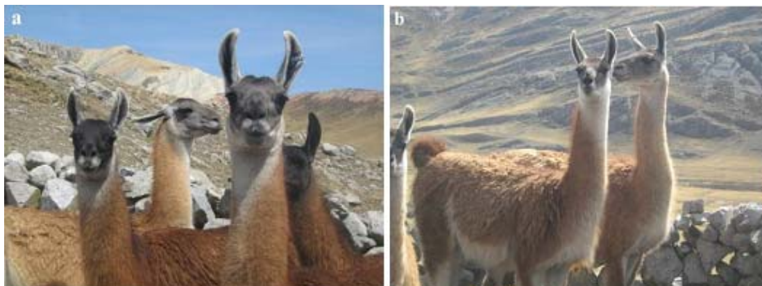
Figura 2. Llamas de Marcapomacocha. (a) Se observa las características de la cara y orejas; (b) Pareja de llamas mostrando tonalidades uniforme de color marrón con franja blanca en la parte ventral

Se calculó las medias y desviaciones estándar de las medidas biométricas. Sólo los valores de llamas mayores de 4 años (n=30) fueron usados para la comparación con valores obtenidos en otros estudios. Así, las variables biométricas fueron comparadas con los resultados encontrados en llamas del distrito de Huayllay, Pasco (Álvarez, 2001), distrito de Nuñoa, Puno (García y Franco, 2006), distrito de Santa Rosa de Juli, Puno (Paca, 1977), del departamento de Cusco (Estrada, 1983) y del Centro Experimental La Raya, Puno (Maquera Llano, 1991). Además, para determinar la semejanza de la población de llamas de Marcapomacocha con sus antecesores, los guanacos, se compararon las variables biométricas con los resultados encon-