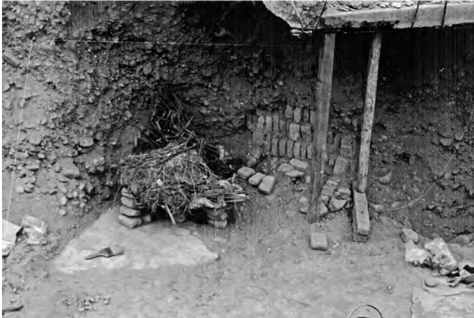
1. Fardo A (12A) luego de su limpieza y retiro de ofrendas.