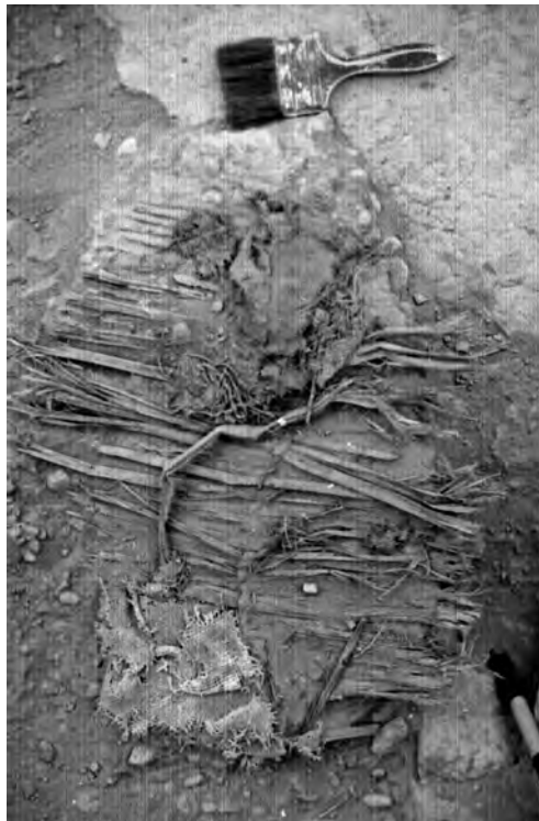
2. impronta del Fardo A luego de su retiro. Se puede observar que la estructura de cañas fue depositada sobre una torta de barro húmedo.