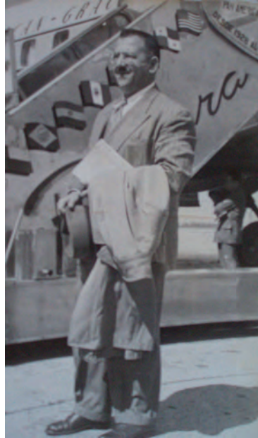
Figura 4. En Santiago de Chile, cuando es nombrado Subdirector de la OACI.