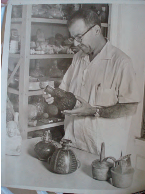
Figura 6. Examinando cerámica peruana en la Academia de Ciencias de Cuba en 1966.