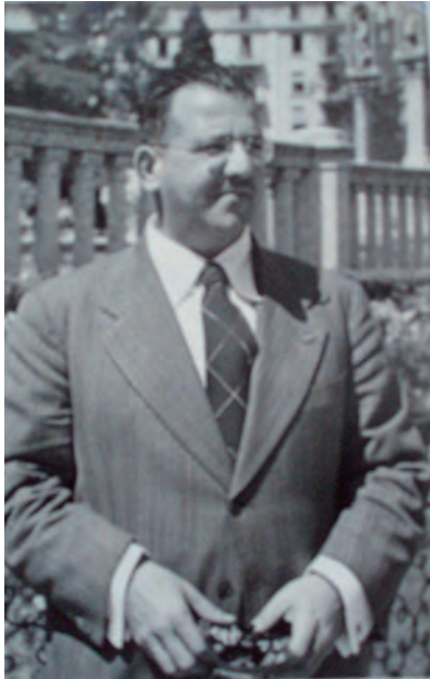
Figura 3. Durante la conferencia de la OACI en Ginebra, Suiza, el 1 de junio de 1948.