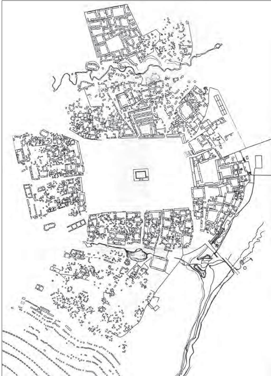
Figura 3. Plano de Huánuco Pampa según Craig Morris y Donald Thompson (1985).