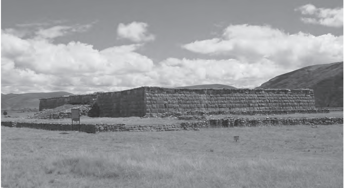
Figura 1. Plataforma Ushnu de Huánuco Pampa.

Posteriormente otro investigador norteamericano, Dan Shea, refiere que la utilización de la palabra ushnu en los estudios andinos no empieza con Zuidema, sino con el antropólogo cusqueño Dr. Chávez Ballón que sugiere se denomine usnu , o de acuerdo al runa simi local de la provincia de Dos de Mayo (Huánuco) con la palabra ushnu , a la estructura central del sitio inca de Huánuco Pampa (Shea 1966: 108), en el año 1965 durante la ejecución del Proyecto de la Vida Provincial Incaica del Institute of Andean Research dirigido por John Murra.