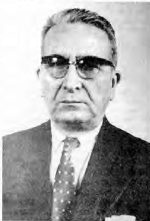
Luis E. Valcárcel.

Valcárcel encontraría la referida coyuntura política durante el segundo gobierno o el "onceño" de Augusto B. Leguía (1919-1930). Por eso, si bien Valcárcel fue el productor oficial de la evidencia material para el indigenismo, no pudo escapar al ambiente político de su época, concentrándose en la reproducción de un sentimiento nacionalista, apropiado y utilizado por el Gobierno al cual se alió. Así, terminó convirtiéndose en el intelectual orgánico de la burguesía