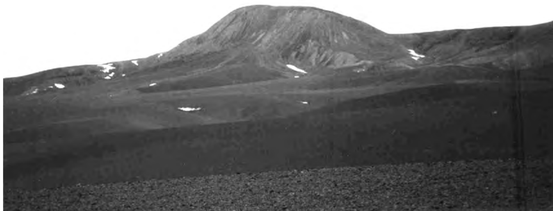
Figura 2. Vista del cerro Pilar.

tra emplazado un extenso tambo incaico, asociado a un inusual conjunto de plataformas ceremoniales ubicadas junto al borde mismo del espejo de agua. La asociación directa de las plataformas con la laguna sugiere que esta última también habría sido objeto de veneración (Ceruti 2003c)