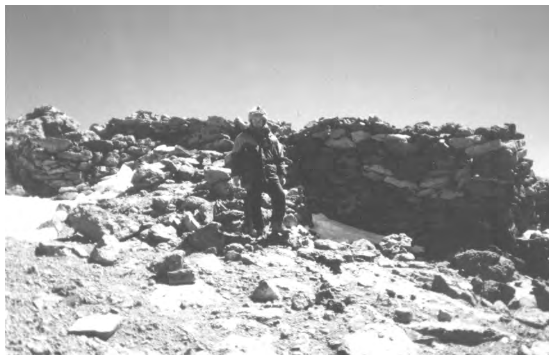
Figura 5. Plataforma ritual incaica en la cumbre del nevado del Quehuar.