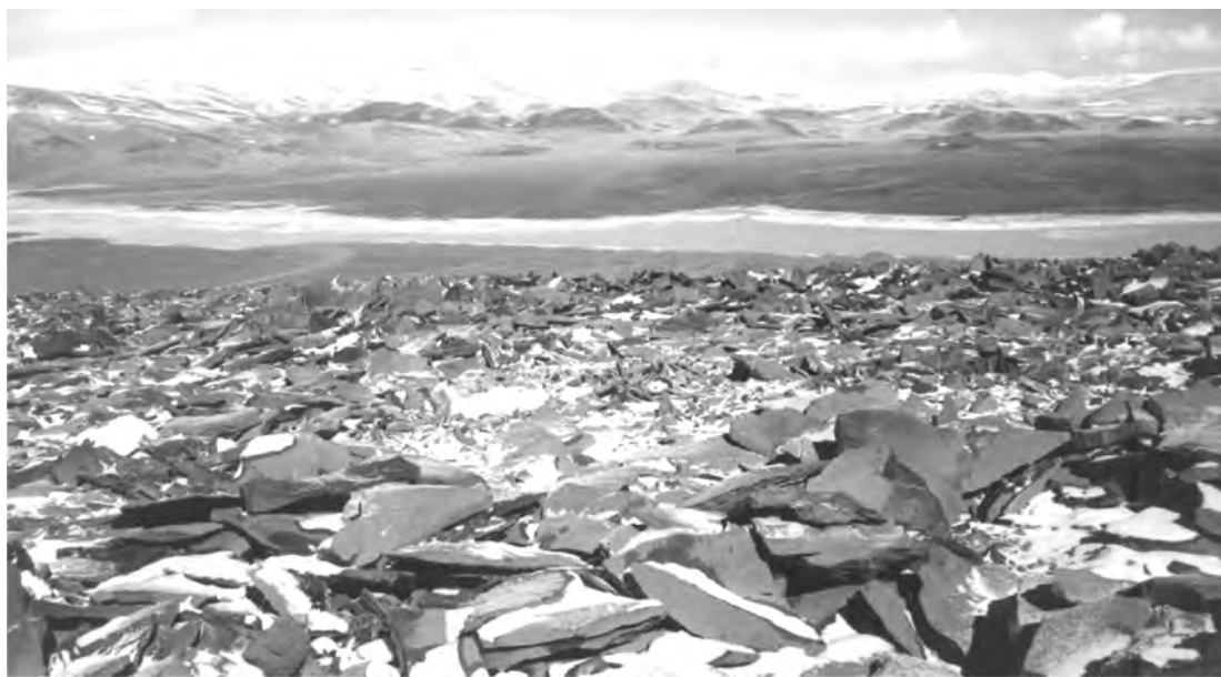
Figura 3. Vista de depósito de leña en el cerro Pilar.

El nevado de Cachi se extiende hacia el norte por la margen occidental del valle Calchaquí. La autora tuvo oportunidad de visitar el importante santuario Inca a 6.150 metros, en la cima bautizada como “Melendez”, a la vez que pudo observar depósitos de leña indicadores de ascensos prehispánicos en las cumbres menores denominadas Pirámide y Di Pasquo (Ceruti 1999a). Las prospecciones en los cerros