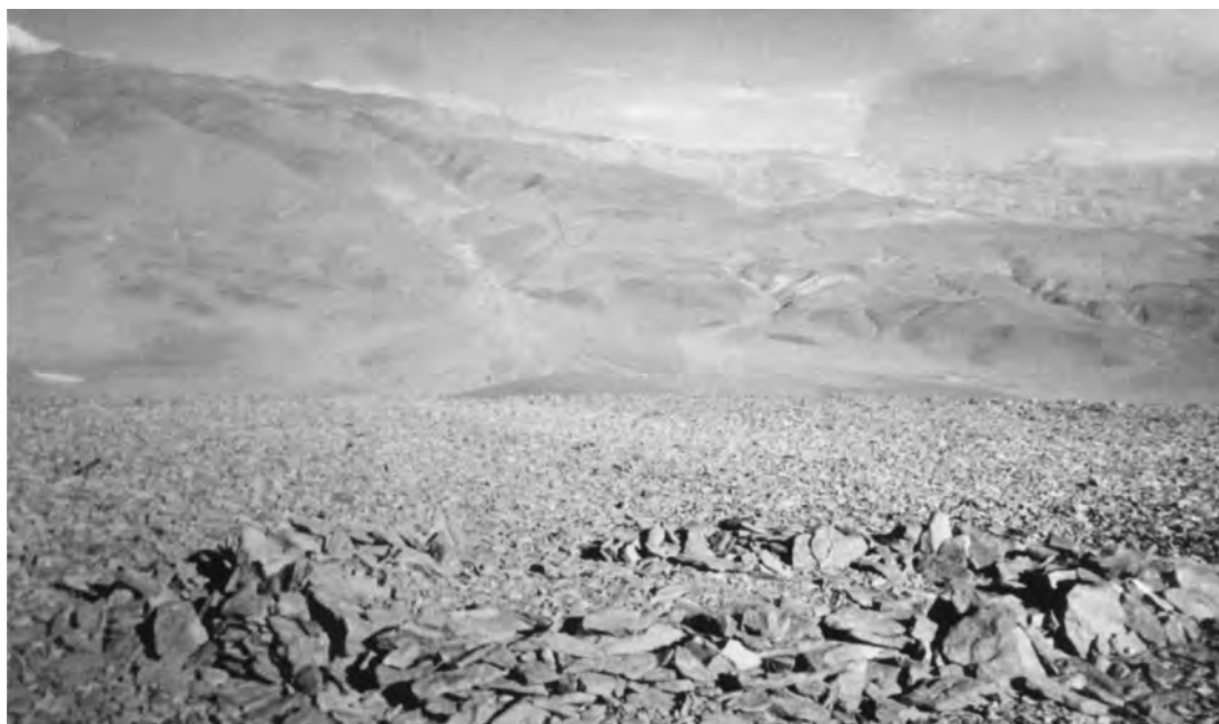
Figura 4. Rectángulo en la cima de volcán Pocitos.