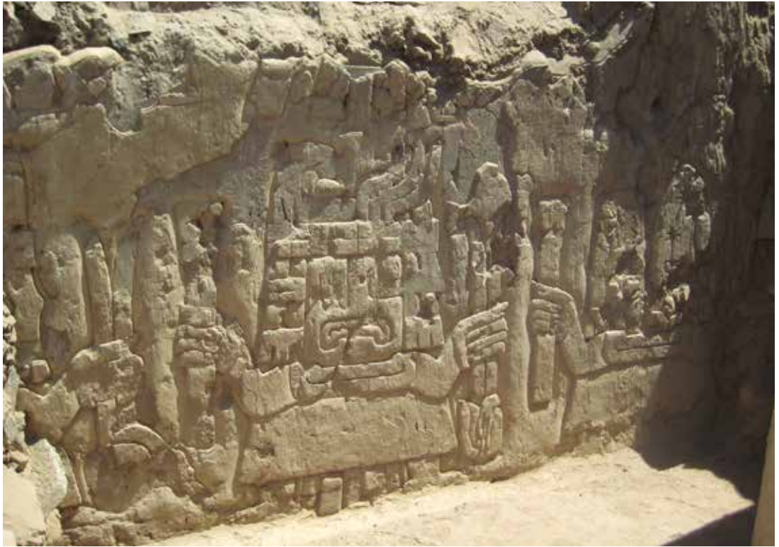
Figura 4. Relieves de barro de Sechín Bajo, Tercer Edificio (1500-1200 aC).