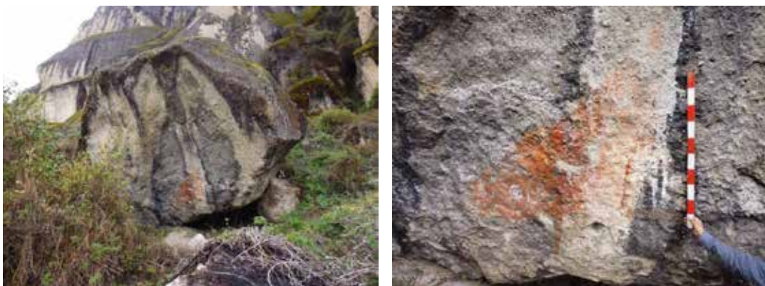
Figura 23: izquierdo: Vista panorámica del Abrigo Rocoso N° 5 en la que se aprecia las pinturas rojas adherida a la a la roca. Figura 24: derecha: Vista de detalle del Abrigo Rocoso N° 5 en la que se aprecia las pinturas rupestres adherida a la a la roca.

Abrigo rocoso N° 05: Se ubica a unos 40 metros del pie del cerro Santa Kuta y se encuentra con una orientación hacia el oeste, que presenta una pequeña oquedad de 5 metros de ancho por 2 metros de profundidad y una altura de 3 metros. No se aprecia osamenta humana. En las paredes presenta 2 manchas de color rojo de regular dimensión, una de las manchas a manera de pintura rupestre le da forma a un pez donde los ojos son círculos concéntricos de color blanco y sobre esta ella, en un lado extremo presenta superposición decorada de color crema.