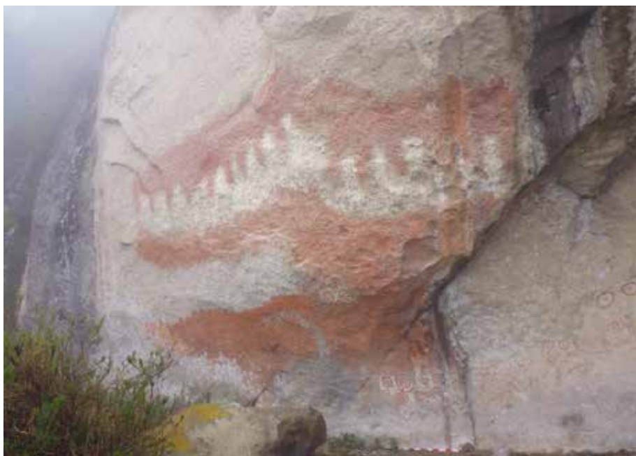
Figura 15: Vista de detalle de la gran dimensión de pictografía roja y blanco ubicada en el lado extremo noreste del abrigo de Pinturamachay.

No es posible determinar con precisión la asociación cronológica de este sitio, aunque no se ha evidenciado material cultural mueble en los alrededores. El estado de conservación es regular. Las pinturas rupestres se encuentran alteradas en su mayoría por los factores climáticos. El abrigo rocoso sirve como refugio de animales que dejan abundante estiércol.