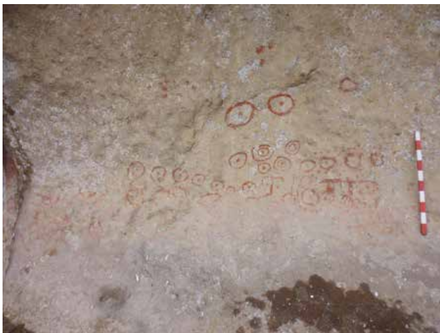
Figura 13: Vista de detalle de motivos geométricos y motivos zoomorfos correspondiente al panel 4.