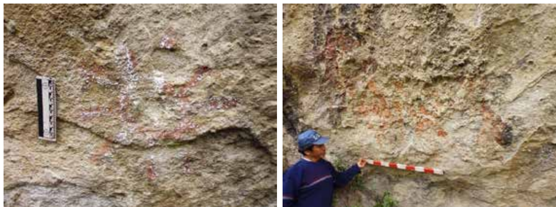
Figuras 32 y 33: Vista de dos pinturas rupestres.