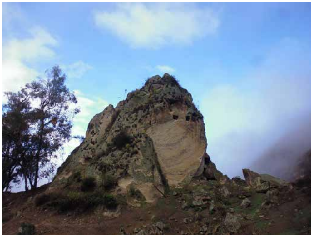
Figura 16: Vista de detalle del sitio Uruguay, tomada desde el lado Este.