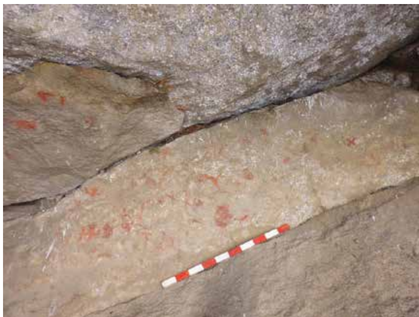
Figura 3: Vista Panorámica del panel 2 del abrigo rocoso del Cerro Kunka.