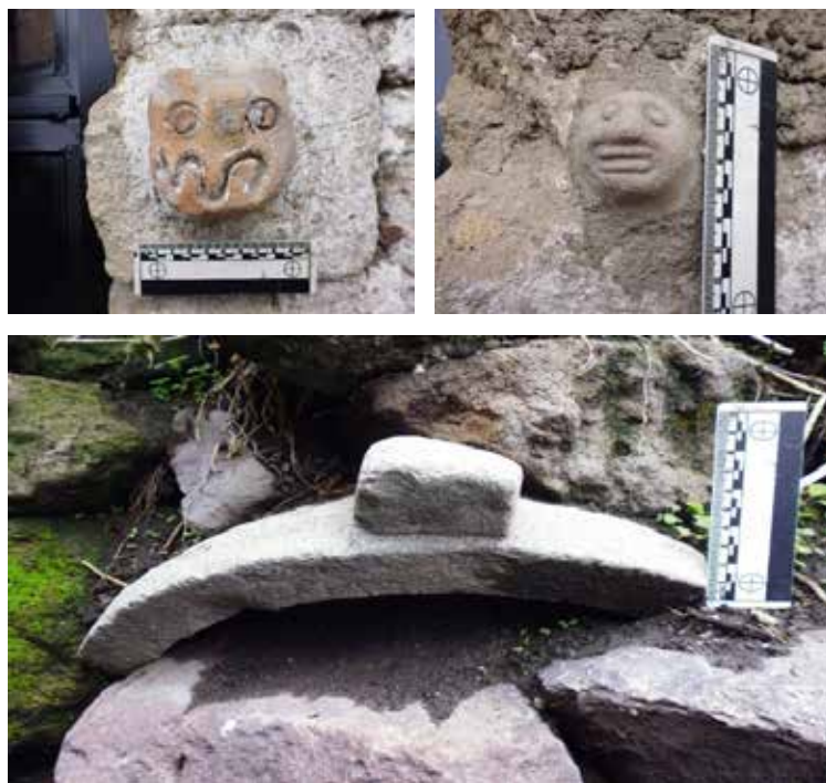
Figuras 27, 28 y 29: Vista de materiales observados en los alrededores del sitio Jollqemarca.