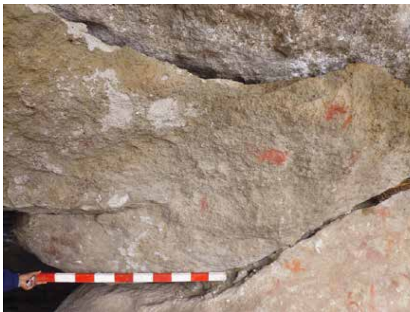
Figura 2: Vista Panorámica del panel 1 del abrigo rocoso del Cerro Kunka.

conservación es regular. Las pinturas rupestres se encuentran alteradas en su mayoría por los factores climáticos y medioambientales. Este abrigo rocoso sirve como refugio de animales ovinos que dejan abundante estiércol.