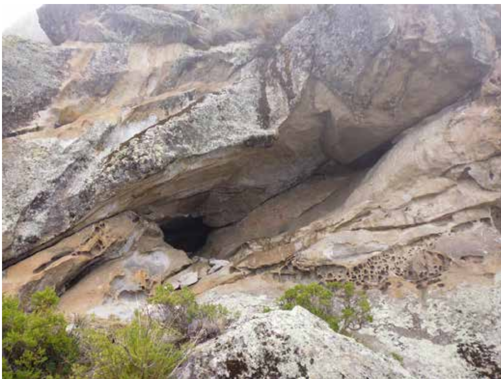
Figura 1: Vista panorámica del abrigo rocoso del Cerro Kunka tomada desde el lado Sur.

- Fase 1: Pintura color rojo intenso: Está conformado por 19 motivos no definidos (a manera de manchas de color rojo) y 3 motivos geométricos a manera de “X” (aves en vuelo), que tienen un promedio de 12 cm por 10 cm.