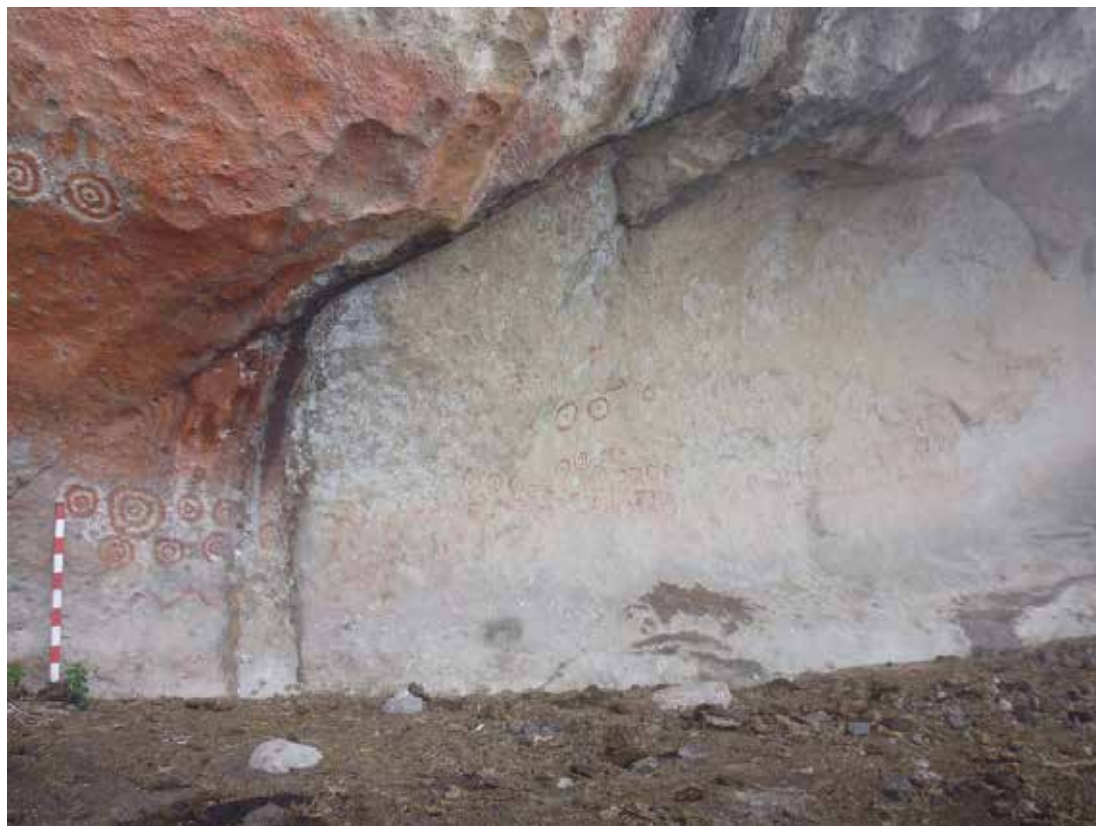
Figura 12: Vista panorámica de motivos del panel 4, Pinturamachay.

Panel 4: Se ubica en el lado izquierdo del abrigo rocoso, se trata de una fila de motivos geométricos, zoomorfos y abstractos; conformados por 18 círculos de color rojo, 26 círculos con un punto concéntrico, 2 círculos dobles con punto concéntricos, 14 círculos a maneras de manchas alineadas en una fila, un motivo zoomorfo; y hacia su derecha un motivo antropomorfo en posición de perfil, cuyo rostro se encuentra deteriorado por factores ambientales sin apreciar sus rasgos, mientras que de su cabeza sobresale una cabellera en forma serpenteante. En la parte superior del motivo antropomorfo hay una hilera de círculos adosados entre sí, presentando hacia el lado izquierdo pequeños motivos fitomorfos. Al extremo norte (parte superior) hay grandes motivos de color rojo y blanco muy deteriorados.