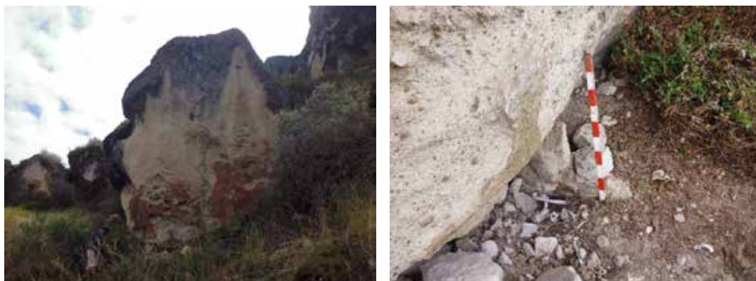
Figura 21: izquierda: Vista panorámica del Abrigo Rocoso N° 3 en la que se aprecia las pinturas rojas adherida a la a la roca. Figura 22: Derecha: Vista de detalle de la estructura adosada a la pared del abrigo rocoso.

Abrigo rocoso N° 04: Se localiza al lado norte del abrigo N° 03. En el interior del abrigo se hallan restos humanos desarticuladas como cráneo, vértebras y costillas.