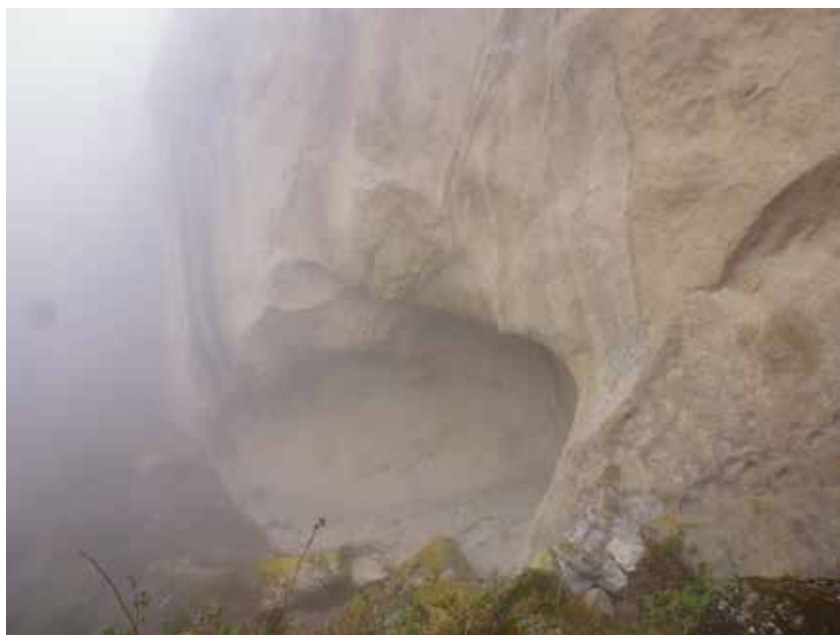
Figura 9: Vista panorámica del abrigo rocoso de Pinturamachay, tomada desde el lado Este.

El yacimiento arqueológico se encuentra en un farallón y está conformado por un abrigo rocoso con evidencias de pintura rupestre. El abrigo rocoso tiene una orientación de este a oeste, de 34.70 metros de largo, 9 metros de altura y una profundidad al interior de 5.60 metros. En la pared plana de la roca se aprecia pinturas de color rojo. Las representaciones eran cerca de 100 motivos, aunque la erosión de la superficie ha borrado el 30 % del total, ocupando desde la parte extrema y media del abrigo rocoso. Los paneles de oeste a este son: