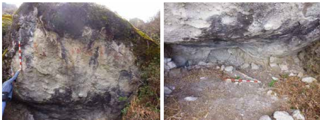
Figura 17: Izquierda: Vista de detalle del Abrigo Rocoso N° 1, en la que se aprecia las pinturas rojas. Figura 18: Derecha: Vista de detalle del interior del abrigo Rocosos N° 1.

Abrigo rocoso N° 1: Es un abrigo rocoso cuya orientación es hacia el lado oeste, con un largo de 4.20 metros, altura de 3.10 metros y una profundidad de 3.10 metros. En la entrada al abrigo, se encuentra restos de una chullpa de planta ovalada adosado a la roca natural, con la técnica constructiva a base de piedras planas unidas con argamasa. El diámetro es de 4.60 metros, con un espesor del muro 0.60 metros y una altura conservada de 0.90 m. El estado de conservación es regular, no presenta techo, los alrededores del abrigo está cubierto con vegetación herbácea. Por otro lado en las paredes (parte superior de la arquitectura) se aprecian manchas borrosas de color rojo, un patrón de la zona funeraria.