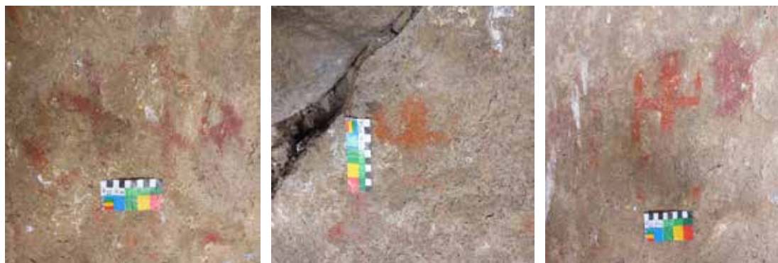
Figuras 4, 5 y 6: Vista de detalle de las superposiciones del panel 2, abrigo rocoso del Cerro Kunka.