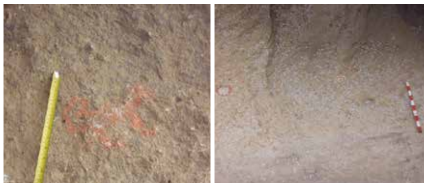
Figura 10: Izquierda: Vista de detalle de motivo Zoomorfo correspondiente al panel 1, de Pinturamachay. Figura 11: Derecha: Vista de detalle de motivos geométricos correspondiente al panel 2.

Panel 1: Se emplaza en el lado extremo derecho del abrigo rocoso, conformado por un motivo zoomorfo, con características de un zorro que se encuentra en posición de perfil, cuyo rostro se dirige hacia el lado sur, con las orejas paradas y cola enroscada, de 20 cm de largo y 8 cm de alto.