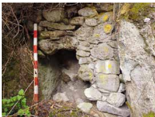
Figura 25: izquierda: Vista Panorámica del sitio Jollqemarca, tomada desde el lado Sur. Figura 26: Derecha: Vista de detalle de los paramentos de terrazas ubicadas en la parte inferior del farallón del sitio Jollqemarca.