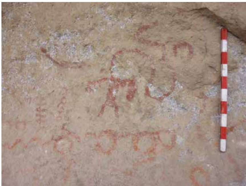
Figura 14: Vista de detalle del motivo antropomorfo, motivo Fitomorfo, motivos geométricos correspondientes al panel 4.