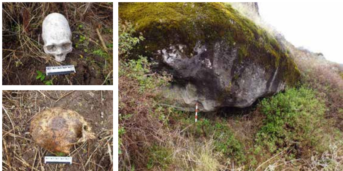
Figura 19: Izquierda: Vista Panorámica del Abrigo Rocosos N° 2. Figura 20: Derecha: Vista de detalle del material óseo hallada en el interior del Abrigo Rocosos N° 2.

Abrigo rocoso N° 02: Se ubica a unos 15 metros hacia el norte del abrigo N° 01, con una orientación hacia el oeste, presenta 6.50 metros de largo por 2 metros de profundidad y una altura de 2.50 metros. En el interior se aprecia osamenta humana tanto de adultos como de niños todas desarticuladas distinguiéndose cráneos deformados, tibia, costillas, vértebras, pelvis y otros huesos fragmentados. El acceso del abrigo se encuentra cercado con un muro de piedras medianas sin argamasa, con abundante vegetación, adosada a la roca natural.