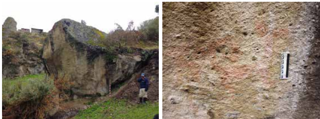
Figura 30: izquierda: Vista panorámica del abrigo rocoso y pintura rupestre del Sitio de Seprispampa. Figura 31: Derecha: Vista de detalle de pintura rupestre de motivo zoomorfo Sitio de Seprispampa.

El sitio corresponde al Intermedio Tardío. La cueva y abrigos rocosos presentan una alteración por parte de animales como vacunos y ovinos, que han dejado abundante estiércol.