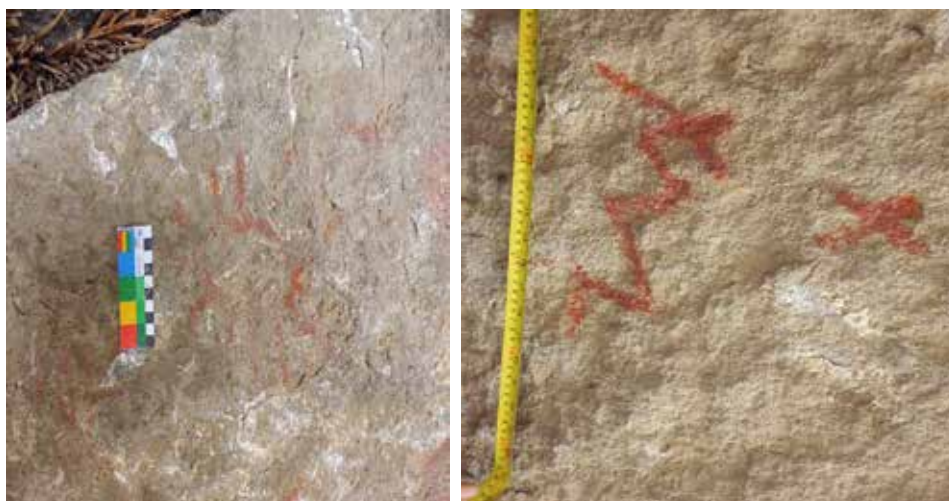
Figura 7: Izquierda: Vista de detalle de motivo geométrico, sol irradiado del panel 2 del Cerro Kunka. Figura 8: Derecha: Vista de detalle de motivos geométricos del panel 3 del Cerro Kunka.