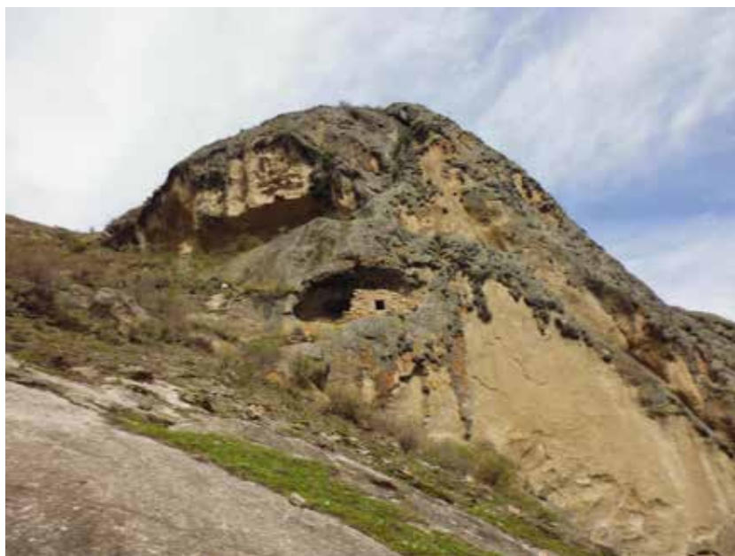
Figura 34: Vista Panorámica del Sitio Dos ventanas, se aprecia el abrigo rocoso con la estructura funeraria.