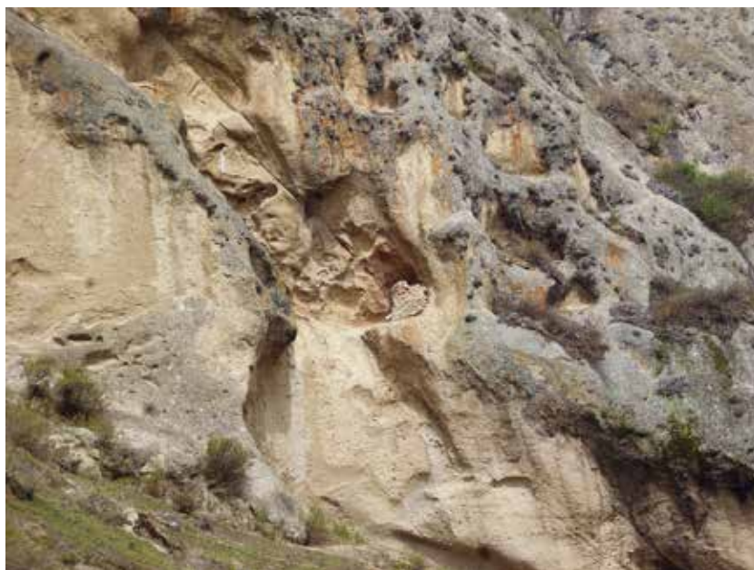
Figura 35: Vista de detalle del sitio Dos Ventanas, se aprecia el abrigo rocoso con la estructura funeraria con evidencia de pictografía roja, a maneras de manchas.