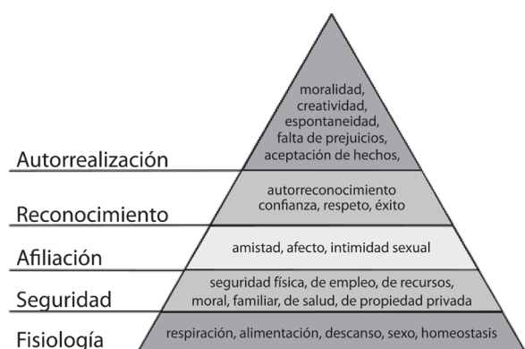
FIGURA Nº 1 PIRÁMIDE DE LAS NECESIDADES HUMANAS SEGÚN ABRAHAM MASLOW.

Como se puede advertir en la pirámide, las necesidades fisiológicas se encuentran en la base de esta, luego le sigue las de seguridad. Las primeras están referidas a las necesidades del ser humano sobre su alimentación y nutrición, el guarecerse del clima vale decir vestimenta, calzado y la necesidad de su vivienda o morada, la reproducción responsable, a su esparcimiento y recreación entre otras necesidades propias de este nivel de las necesidades fisiológicas. Entiéndase en este nivel de la escala que el ser humano al nacer ya requiere de la inmediata satisfacción de ellas, por tanto su atención es totalmente dependiente durante sus primeros años de vida hasta los 14 años por ser la edad base de acceso al mundo laboral según los criterios utilizados en la determinación de la Población Económicamente Activa (PEA), en algunas sociedades, y al mismo tiempo según la suerte (factor aleatorio) del individuo al nacer, lo que algunos equivocadamente llaman destino.