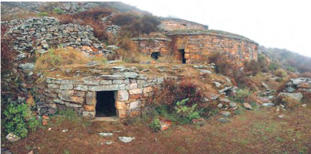
Un recinto de Cantamarca. De planta circular y columna trapezoidal que sostiene un techo en forma de falsa bóveda.