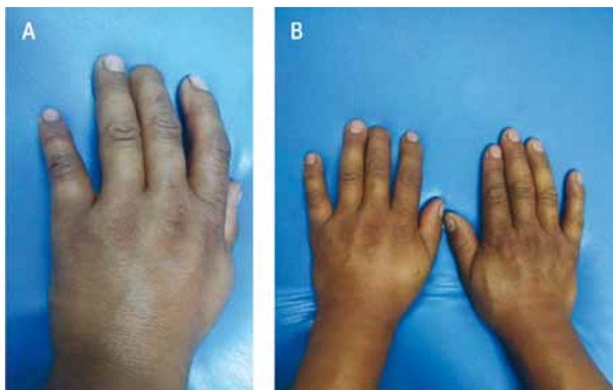
Figura 1. A: Se observa herida en quinto dedo de la mano izquierda. B: Comparativamente, hay un aumento de volumen en la mano izquierda.

En la radiografía de mano izquierda se observó enfisema subcutáneo (figura 2). El paciente recibió como terapia empírica cefazolina 1g EV c/8 h. Luego de 36 h se observó una disminución