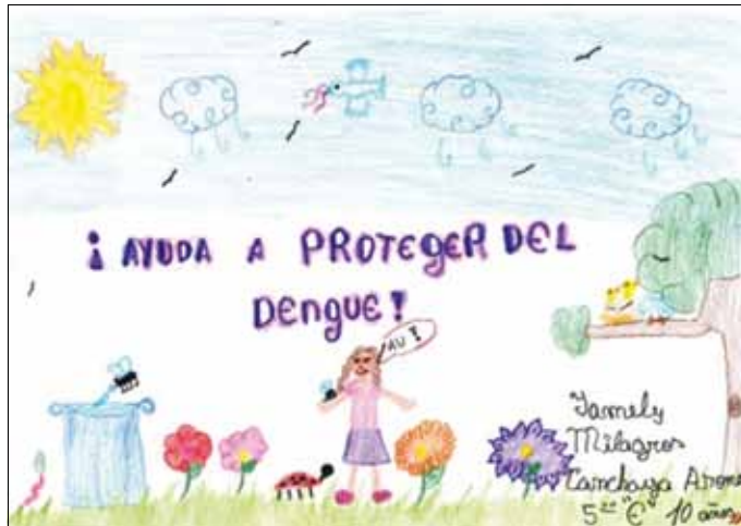
Figura 2. Almacenamiento de agua como factor de riesgo para la infestación por el vector del dengue, dibujo de una niña de 10 años de quinto grado.

estudiantes del estado de Maranhão, Brasil (17) , Chiapas, México (18) y Tailandia (20,23) ; sin embargo, en los dibujos realizados por los brigadieres, está muy claro que el dengue es transmitido por la picadura de los mosquitos. A pesar de ello, es importante enfatizar las formas de transmisión en todos los espacios, como los colegios, en las visitas domiciliarias y en los mensajes que se difunden en los medios de comunicación social.