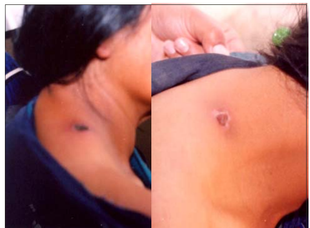
Figura 5. Izquierda: Úlcera necrótica de carbunco en región supraclavicular. Derecha: Luego del tratamiento con penicilina oral.