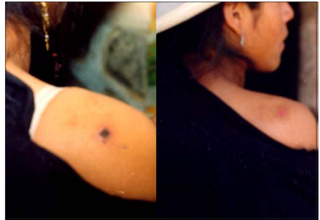
Figura 3. Izquierda: Úlcera necrótica en estadio avanzado. Derecha: Luego de tratamiento con penicilina oral la lesión remite.

de la toxina del B. anthracis . El factor edema altera la función de los neutrófilos y la cápsula impide la fagocitosis (13). En relación a la analgesia, ésta se explica probablemente porque el factor letal de la toxina del B. anthracis daña el terminal nervioso (16).