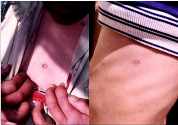
Figura 2. Úlcera cutánea de carbunco en estadio precoz (“la waytacha”) en dos pacientes, regiones esternal (izquierda) y torácica (derecha).