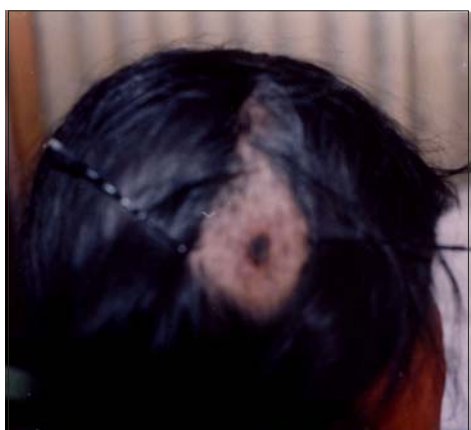
Figura 6. Úlcera necrótica extensa en cuero cabelludo.

penicilina, estos son casos aislados. La terapia parenteral debería ser reservada para casos de carbunco con sospecha o evidencia de diseminación sistémica.