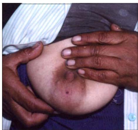
Figura 1. Lesión de carbunco en estadio de mácula.

Todos los casos fueron cutáneos, que es la principal forma clínica, y correlaciona con la