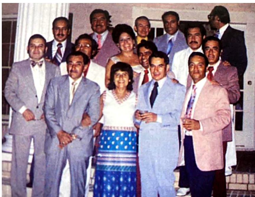
Figura 1. Reunión de los 15 fundadores de la PAMS en Atlanta, 8 de septiembre de 1973.

La PAMS mantiene convenios vigentes de colaboración con organizaciones importantes en EE.UU. y en el Perú que incluyen a la Academia Nacional de Medicina del Perú; Baylor College of Medicine, Houston, Texas; Case Western Reserve & Cleveland Clinic Medical Schools, Cleveland, Ohio; Colegio Médico del Perú; Compañía de Minas Buenaventura; EsSalud (Seguro Social de Salud del Perú) y MINSa (Ministerio de Salud del Perú); Facultad de Medicina de San Fernando, Universidad Nacional Mayor de San Marcos; Facultad de Medicina Alberto Hurtado, Universidad Peruana Cayetano Heredia; Facultad de Medicina, Universidad Católica De Santa María, Arequipa; Facultad de Medicina, Universidad Nacional de Trujillo; Facultad de Medicina, Universidad Ricardo Palma; Facultad de Medicina de la Universidad Científica del Sur; Pacífico Seguros, Lima, Perú. Estas relaciones facilitan la organización de misiones médico-educativas provenientes de EE.UU. y su implementación en el territorio peruano.