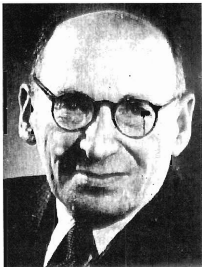
Fig. Nº 2.- (Lwów 1896 - Ness-Ziona 1961). El médico judío-polaco Ludwik Fleck es hoy reconocido como un pionero de la tendencia constructivo-relativista en la filosofía de la ciencia y de la aproximación sociológicamente-orientada para el estudio de la evolución del conocimiento científico y médico. La perspectiva analítica de Fleck pone énfasis en los condicionantes externos de la ciencia. Fleck establece los conceptos de "estilo de pensamiento" y "colectivo de pensamiento", que resultarán inspiradores para Thomas Kuhn, quien en el prólogo de su famosa obra La Estructura de las revoluciones científicas (1962), lo redescubre.