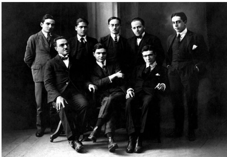
Fotografía 1. Jóvenes de la Generación del Centenario