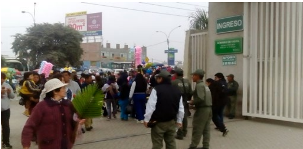
Imagen 19. Entrada principal.

Al ingresar al cementerio pude evidenciar que los visitantes sobrepasan los 2000, pero no es tan difícil poder desplazarme dentro. Para poder conseguir el recurso hídrico, no es necesario hacer cola, ya que hay varios lugares donde se puede conseguir agua. (Nota de campo del domingo 17 de junio de 2018, aproximadamente a las 3:10 p.m.)