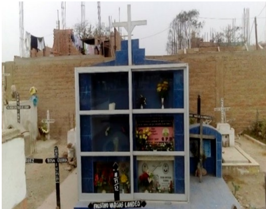
Imagen 7. Nichos con una buena infraestructura.