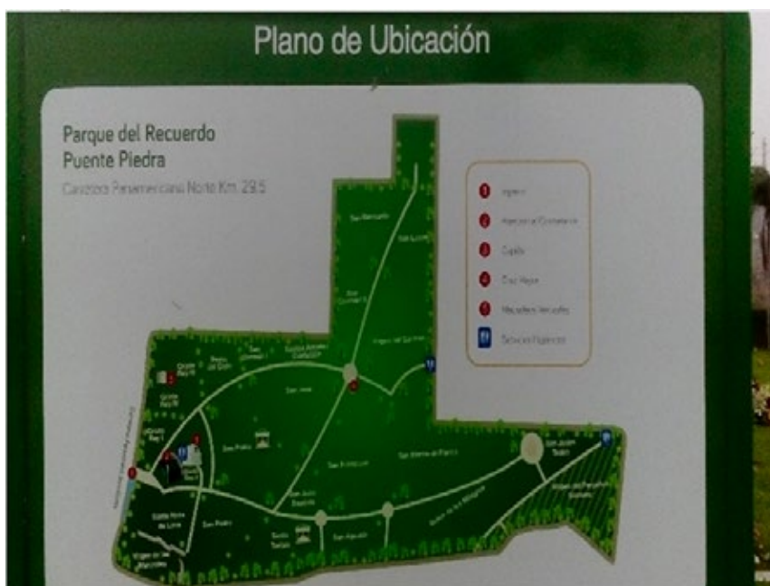
Imagen 16. Señalización.

En cuanto a la infraestructura del cementerio, noto que se encuentra en buenas condiciones, los caminos están adoquinados, existen varios caños donde se consigue el agua, así como adecuadas señalizaciones de la distribución de los nichos.