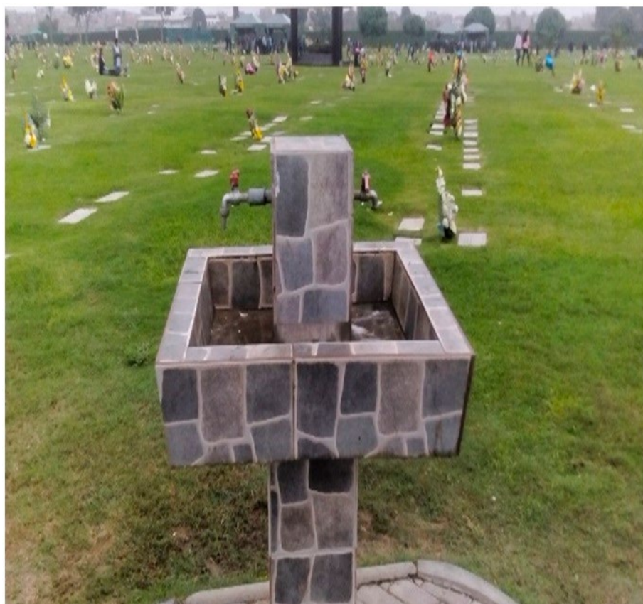
Imagen 17. Recurso hídrico.