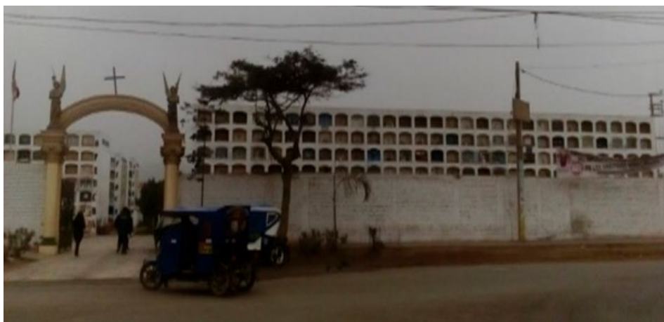
Imagen 3. Entrada del cementerio municipal.

[..] Llego al paradero llamado óvalo de Zapallal, entonces procedo a dirigirme al cementerio. Antes de entrar al cementerio, observo que está cercado por un muro, está vigilado solo por un guachimán y, como es característico, se encuentra puestos de comerciantes (flores, golosinas, ataúdes); sin embargo, solo son unos cuantos puestos. ¿Esto se deberá a que no vendrán muchos visitantes? [..] Al momento de entrar al cementerio, supuse que el guachimán me pediría alguna identificación, puesto que no llevaba un ramo de flores para un difunto, pero no sucedió así, logré ingresar sin ningún inconveniente. (Nota de campo del domingo 10 de junio de 2018, aproximadamente a las 10:20 a.m.)