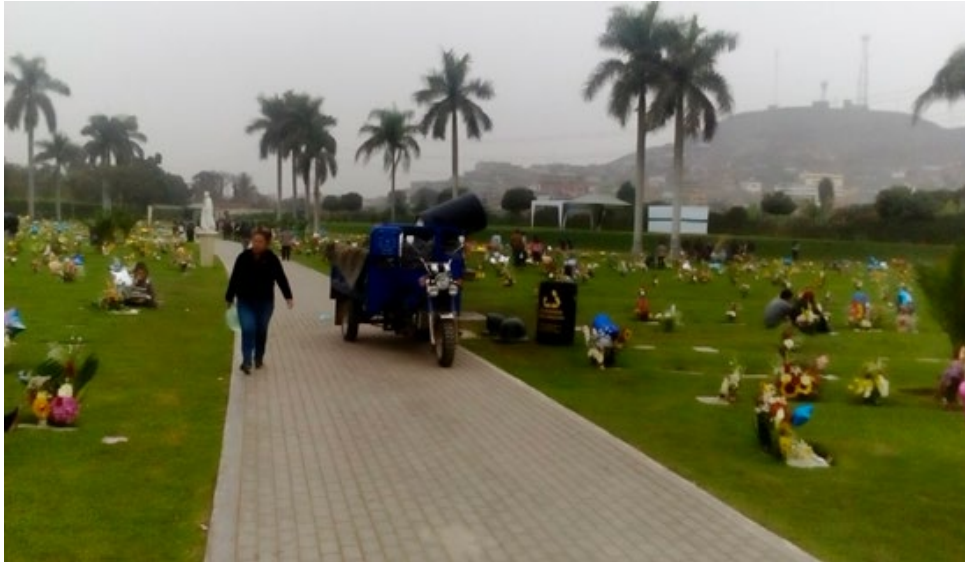
Imagen 18. Limpieza de los tachos.