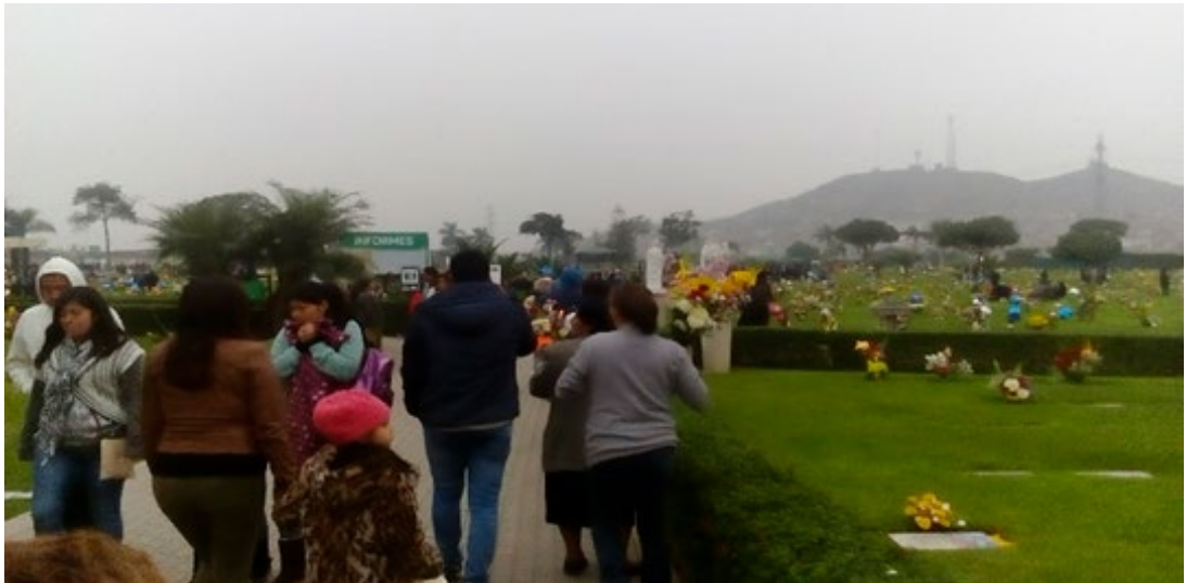
Imagen 20. Visitantes.

Aunque hay muchos visitantes puedo percibir un entorno de paz. ¿Acaso será por el tamaño del cementerio?