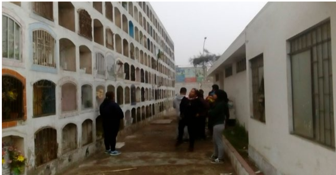
Imagen 10. Recurso hídrico.

A los nichos distribuidos verticalmente solo se puede acceder mediante escaleras. Hay escaleras que la municipalidad brinda, pero cualquiera puede traer su escalera y ofrecer este servicio por el costo de S/. 1.50. Por otra parte, noto la existencia de varios vendedores de agua, al precio de S/. 1.00 la botella.