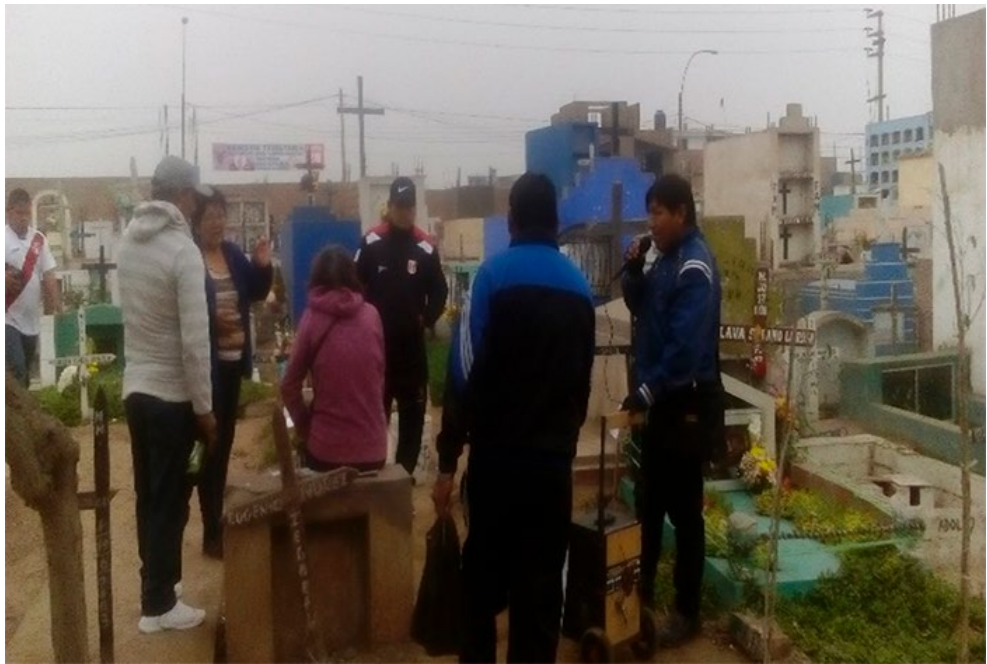
Imagen 13. Ingreso de bebidas alcohólicas y cantantes.