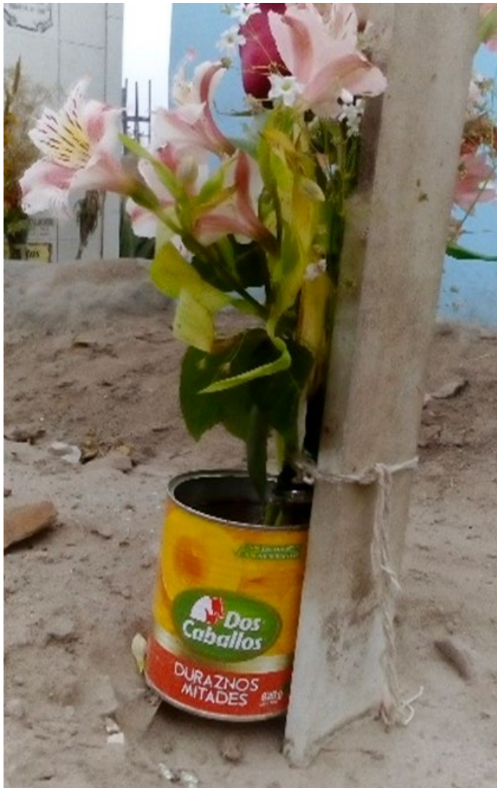
Imagen 8. Recipientes para las flores.