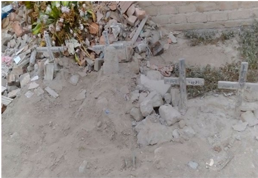
Imagen 6. Nichos sin una infraestructura.