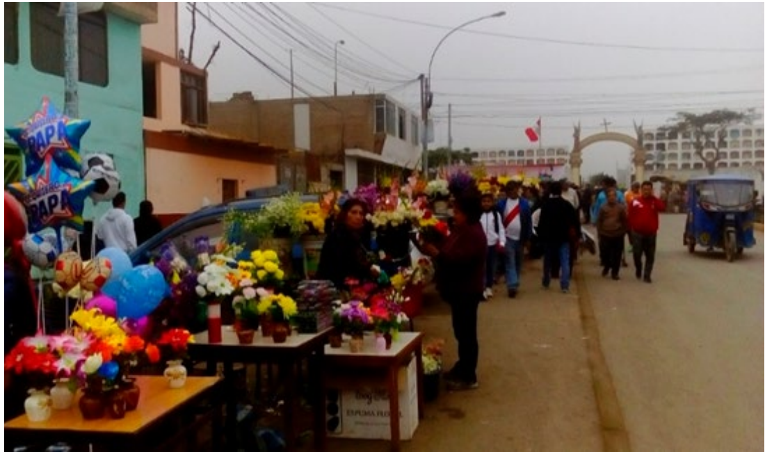
Imagen 9. Vendedores.