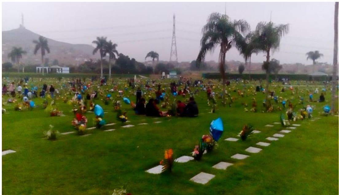
Imagen 21. Entrada principal.

Entonces cabe preguntarse por qué no sucede esto en el cementerio público. ¿Acaso será por una falta de interés de la municipalidad? Tal como lo afirma Vega Centeno respecto a la actitud de los municipios hacia los espacios comunes (2006: 4), “(...) los gobiernos municipales son poco sensibles al mantenimiento de espacios que no les aseguran buena rentabilidad”.