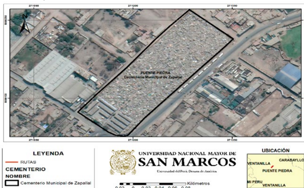
Imagen 2. Cementerio Municipal de Zapallal.

Este cementerio cuenta con dos áreas bien diferenciadas: un sector antiguo y uno nuevo. La zona antigua, ubicada en la parte posterior, cuenta con un gran número de nichos y tumbas construidos a mediados del siglo XX, perteneciente a familias de origen japonés y chino (...). El nuevo sector, y más próximo a la entrada del cementerio, cuenta con nueve pabellones bajo el nombre de santos y santas del evangelio católico.