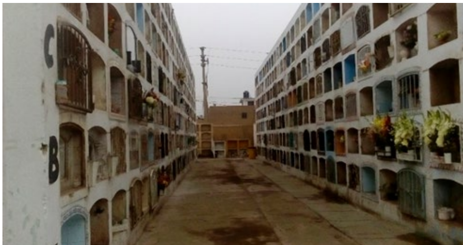
Imagen 4. Distribución vertical de los nichos.

[..] Ya adentro del cementerio, me percaté de los nichos que están distribuidos verticalmente, los cuales están ordenados alfabéticamente y estos solo se encuentran cerca de la entrada, pues más al fondo la distribución es horizontal. ¿Habrá una diferencia socioeconómica en esto? [..] Aunque sea domingo, donde se supone que los visitantes deben ser mayores en número respecto a días de semana, los visitantes no sobrepasan los 50. ¿Acaso esto se deberá al horario, a las condiciones del tiempo o a los aniversarios? (Nota de campo del domingo 10 de junio de 2018, aproximadamente a las 10:40 a.m.)