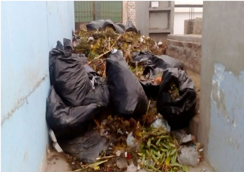
Imagen 11. Manejo de los residuos.