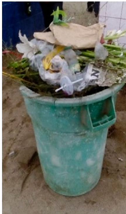
Imagen 12. Acumulación de basura.