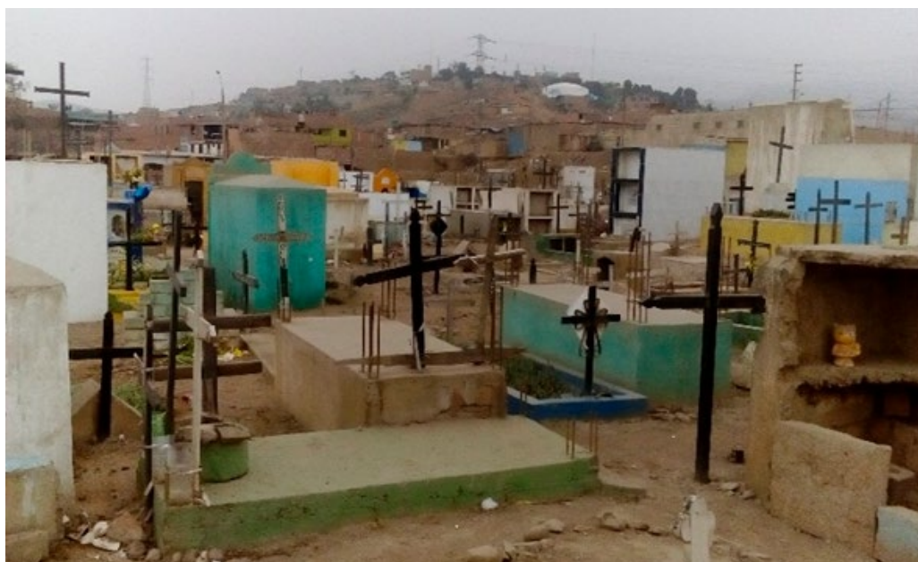
Imagen 5. Distribución horizontal de los nichos y escasas áreas verdes.

Algo característico y desconcertante que encuentro son los nichos que están distribuidos horizontalmente, pues estos están desordenados y no hay señalización de caminos ¿Acaso esto se deberá a que es un cementerio público? [...] Algo que me llama la atención, dentro de esta zona del cementerio, son las escasas áreas de descanso, puesto que solo se encuentra en la entrada unas bancas. Otra carencia que presenta esta zona son las áreas verdes. [...] Dentro del recurso hídrico con que cuenta el cementerio, noto que solo hay un caño, y que el visitante tiene que llevar su propio recipiente para llevar el agua o también puede pagar S/1 para que le lleven el agua al nicho de su difunto. ¿Acaso los visitantes contratarán regularmente este servicio para que exista este negocio dentro del cementerio? (Nota de campo del domingo 10 de junio de 2018, aproximadamente a las 10:50 a.m.)