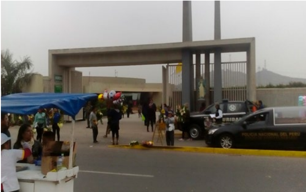
Imagen 15. Entrada del Cementerio Jardines del Buen Retiro.

Al llegar a la entrada, observo que existen varios puestos de vendedores de flores, los cuales están al frente y al costado del cementerio. También existen los vendedores que te ofrecen ramos de flores en la puerta del cementerio. Sumado a esto, existen otros vendedores de golosinas, picarones, globos, etc. ¿Esto se deberá a la cantidad de visitantes que hay a diario? [...] Noto que en la entrada se ubica una patrulla de serenazgo, así como agentes de seguridad del cementerio; sin embargo, sin ningún inconveniente logro entrar al cementerio. En la entrada principal puedo observar el horario de atención, el cual es de 9:00 hasta las 17:30 [...]. Durante el recorrido dentro del cementerio observo que los visitantes sobrepasan los 200, siendo un domingo cualquiera. Respecto a la organización de los nichos, estos solo tienen una distribución horizontal y están organizados por santos (Nota de campo del domingo 10 de junio de 2018, aproximadamente a las 3:10 p.m.)