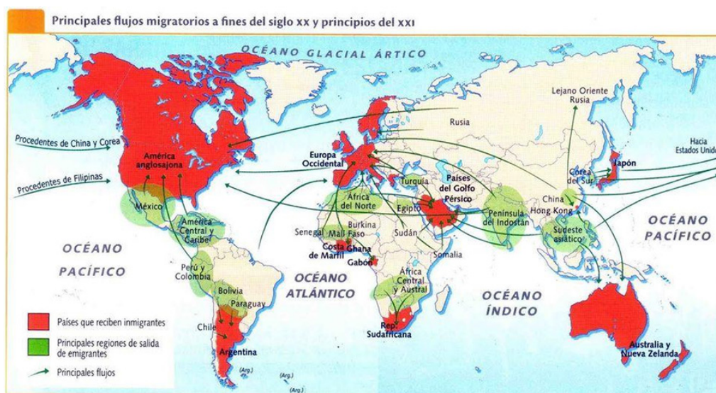
Figura 2. Principales flujos migratorios a fines del Siglo XX y principios del Siglo XXI. Recuperado de: https://www.vozpopuli.com/memesis/Migraciones-Refugiados-Mapas-migraciones-refugiados-mapas_0_920008037.html

otros lugares son elegidos para residir, ya sea como espacio de superación y vida armónica (elección voluntaria) o, ya sea como lugar de refugio (migración forzosa). En el Figura 2, se pueden ver los principales flujos migratorios hoy.