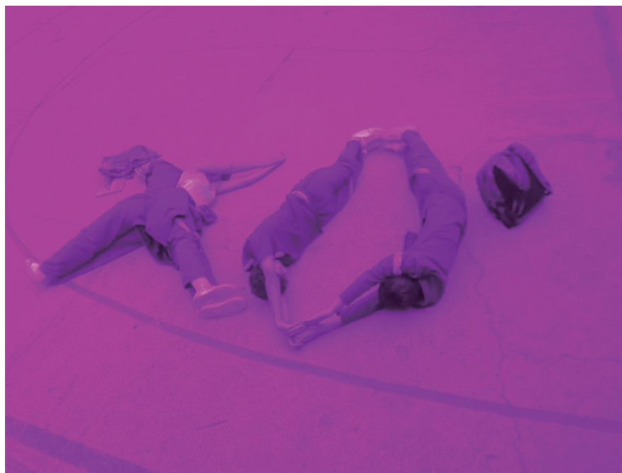
Figura N° 1 - El cuerpo como territorio

Identificamos varios cuestionamientos en los procesos de aprendizaje de nuestros estudiantes, en los cuales se deben priorizar los espacios comunes y compartidos, desde los principios de la propuesta pedagógica muiskanoba. Esta propuesta de innovación pedagógica desde el sur, que como se presentó en el primer apartado, nos invita al reconocimiento de nuestras realidades personales y colectivas para la transformación social de estas, nos invitan al confluir, descubrir y compartir. Desde esta perspectiva, se incentiva a los estudiantes a explorar y reconocer el/su territorio desde diferentes dimensiones, una de ellas es: el cuerpo como territorio. En la siguiente Figura N°1 se muestra la noción del cuerpo como forma de expresión social y simbólica que se comparte en un espacio social. En este caso, el aula de clase se convierte en el lugar donde se comparten expresiones artísticas que desdoblan el cuerpo, el alma y la mente.