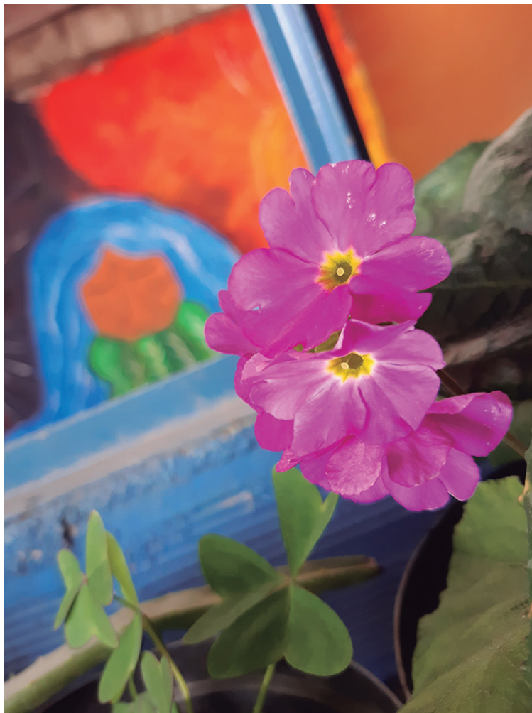
Figura N° 2 - Intimidad-es

Una escala intermedia es el espacio-colegio donde se generan interacciones sociales y experiencias de vida importantes para la apropiación del territorio suachuno, en la Figura N°2 nos lleva a un espacio íntimo del colegio, donde se encuentra la biblioteca y, al fondo, evidenciamos la relación estrecha con la naturaleza, puesto que en la imagen del mural es posible identificar a la madre tierra que regocija el agua y una hermosa flor, que se lleva toda la atención. Esta composición fotográfica nos lleva a reconocernos, que aunque nos encontremos en un espacio construido. No nos desprendemos de la naturaleza, que es nuestra fuente de conocimiento, de vida y de regocijo espiritual.