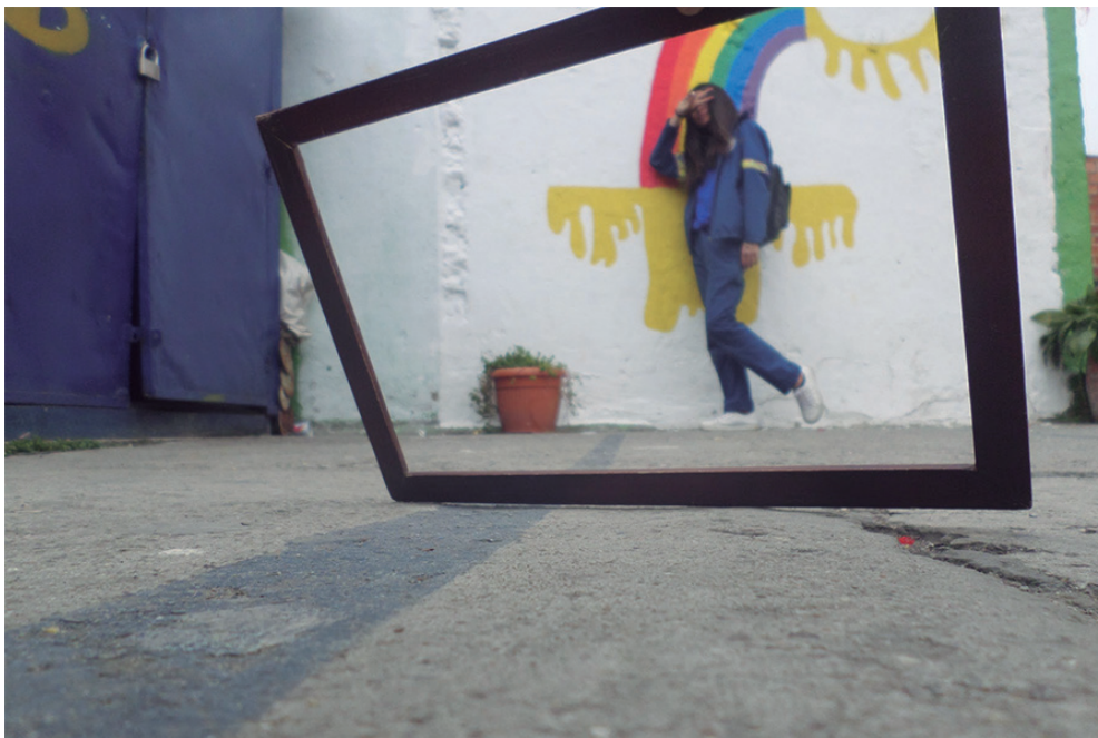
Figura N°4 - Momento relax

Lo anterior expone de manera sintética algunas acciones que se han llevado a cabo en el espacio escolar, nos quedan muchas historias por compartir. En el siguiente apartado se comentarán algunas reflexiones propias.