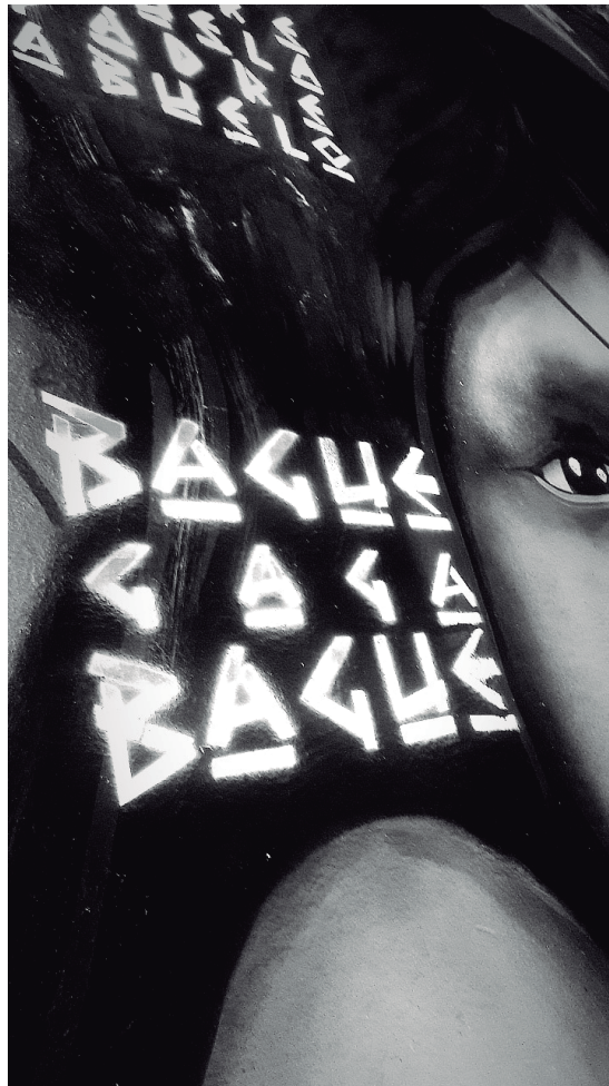
Figura N°5 - Diosa Bachué

Autora: Zharick Salgado, grado noveno (2019). Archivo fotográfico de la Galería muiskanoba.