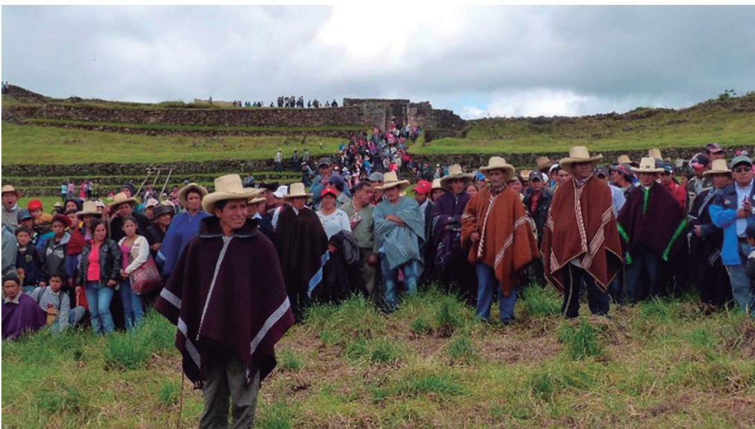
Figura N° 5. Presidente de la FEPROCCA como anfitrión de la Celebración por la inscripción del Qhapaq Ñan a la Lista de Patrimonio Mundial de la Unesco.

Sin embargo, es también un trabajo que puede resquebrajarse con mucha facilidad, los actores patrimonialistas interesados en gestionar dicho sitio arqueológico deben tener presente que construir lazos de confianza es una tarea difícil. Incluso, más difícil cuando se trata de recuperar dicha confianza (Ver Figura 5).