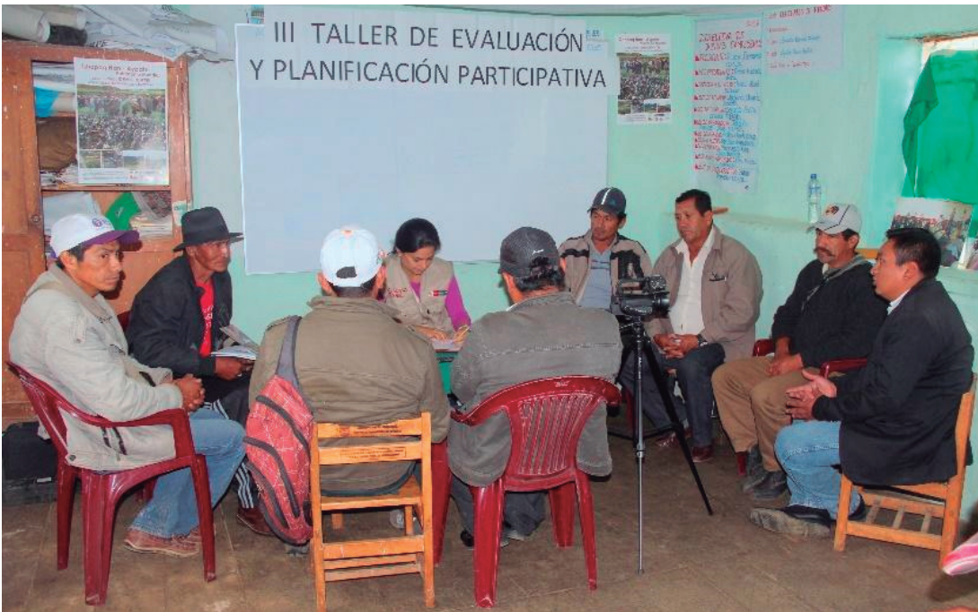
Figura N° 4. Grupo focal con autoridades comunales de Ayabaca