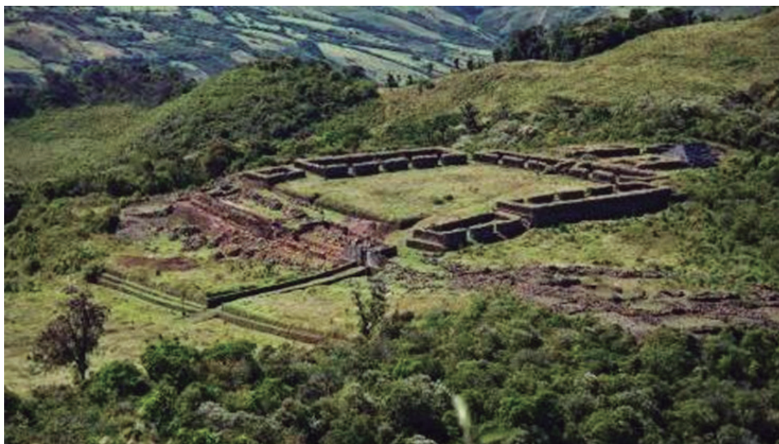
Figura 1. Vista panorámica del sitio arqueológico Aypate

El centro religioso y administrativo Aypate, ubicado en el cerro que lleva el mismo nombre, se ubica aproximadamente en los 2.700 m s.n.m. y comprende edificaciones estatales que caracterizan a los centros provinciales incas como: plaza, acllawuasi , kallanka y ushnu (Astuhamán, 2013) (Ver Figura 1).