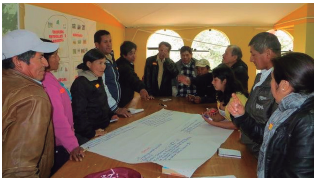
Figura N°3. Diagnóstico participativo con representantes comunales de Ayabaca

Luego, en el 2014 se inició con la planificación participativa de la intervención, en la cual se ejecutó un diagnóstico participativo para el reconocimiento de necesidades y expectativas de la población y la organización conjunta de la celebración por la inscripción del Qhapaq Ñan a la Lista de Patrimonio Mundial de la Unesco(Ver Figura 3).