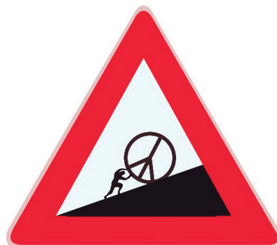
Figura 3. Logo de la Conferencia Temática "Geografías Por la Paz"