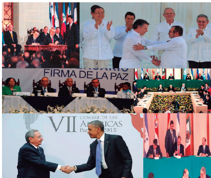
Figura 1. Collage de imágenes de la Paz en Latinoamérica y el Caribe