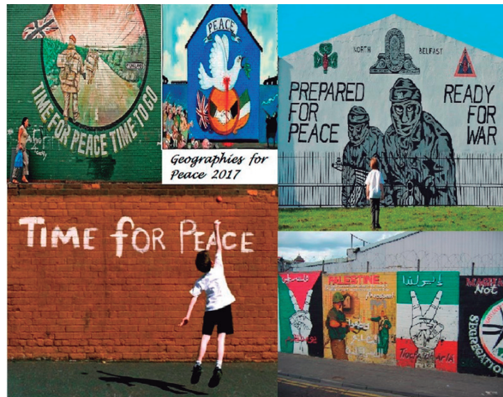
Figura 2. Imágenes de la Paz en las calles de Irlanda