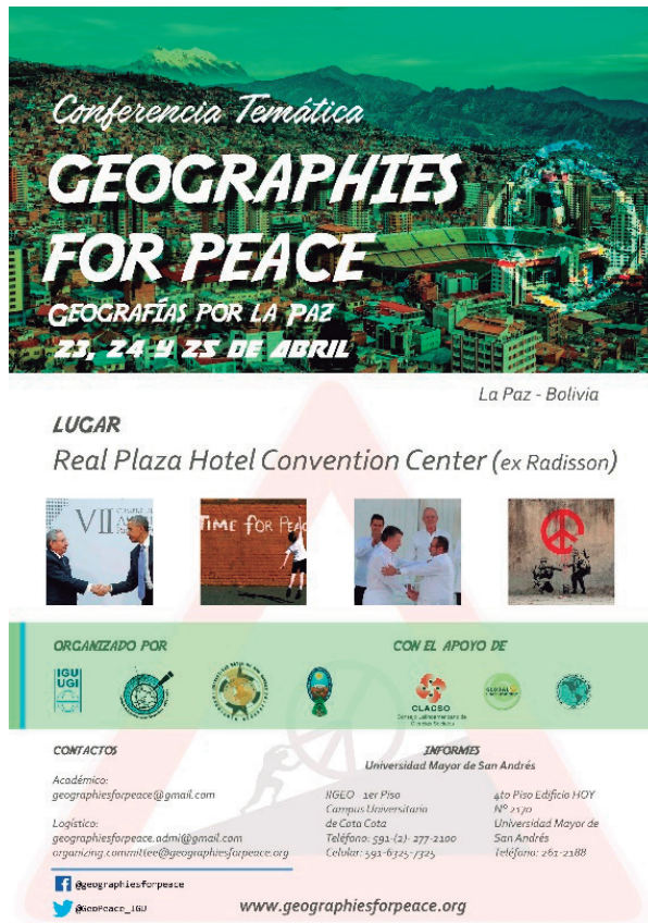
Figura 4. Afiche de la Conferencia Temática 2017