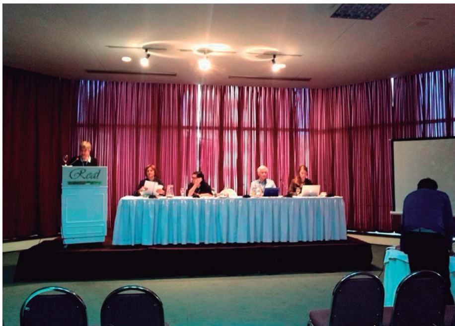
Figura 6. Clausura de la Conferencia Temática La Paz 2017

El evento temático UGI del 2017 tuvo como auspiciadores y coorganizadores al Consejo Latinoamericano de Ciencias Sociales - CLACSO a través del GT - Pensamiento Geográfico Crítico Latinoamericano y al Instituto Panamericano de Geografía e Historia - IPGH a través de su Sección Nacional de Bolivia el Instituto Geográfico Militar.