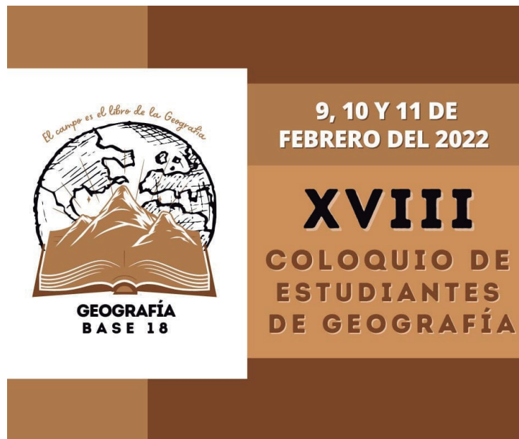
Figura n°1. Flyer del evento anunciando el XVIII Coloquio de Estudiantes de Geografía UNMSM.