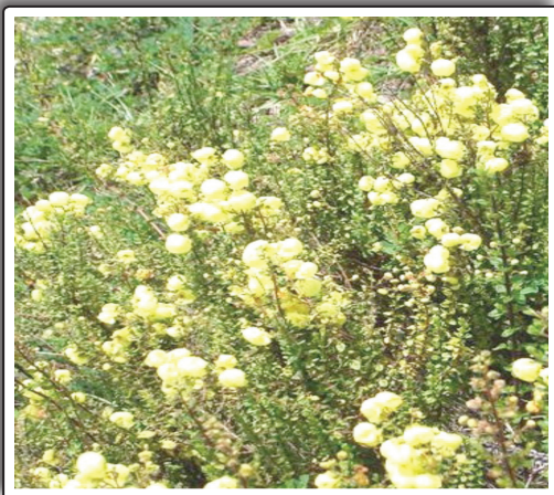
Figura 1. Calceolaria myriophylla "Zapatilla".