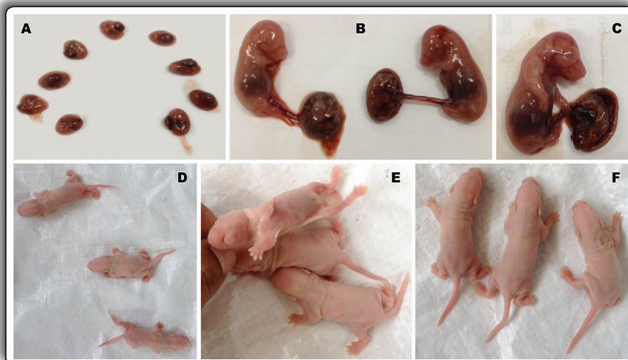
Figura 2. Disección de las bolsas placentarias de ambos grupos (A). Fetos sin alteraciones con sus respectivas placentas (flechas) de ambos grupos (B). Feto de morfología sin alteraciones del grupo experimental (C). Aspectos morfológicos de las crías de ratas del grupo control (D) y grupo experimental (E y F).