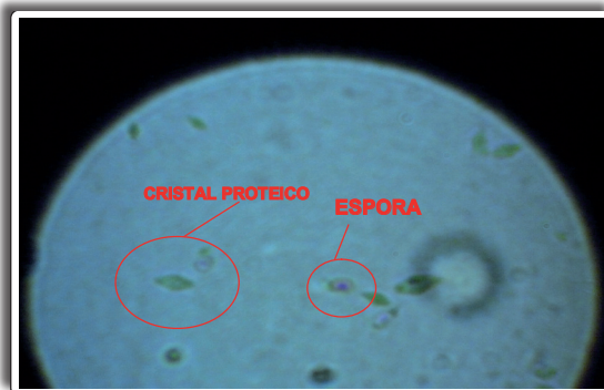
Figura 1. Coloración de B. thuringiensis con Giemsa R 66.

Las larvas de Spodoptera frugiperda se recolectaron de cultivos de Capsicum annuum Linneo, pimiento y de Ipomoea batatas , camote; se buscó en las zonas foliares dañadas de los campos de cultivo, donde se observó su presencia, y se colocaron en envases de plástico para su transporte a los laboratorios de Control Biológico-SENASA del Ministerio de Agricultura. Las larvas colectadas se lavaron con una solución de cloro al 0,02% y se dejaron secar en papel toalla, una vez secas se colocaron individualmente en