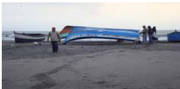
Figura 2 - Segundo trabajo de campo

La Figura 3 muestra una imagen del tercer trabajo de campo en el proyecto especial Chavimochic y la entrevista realizada al Gerente General, el ingeniero Huber Vergara.