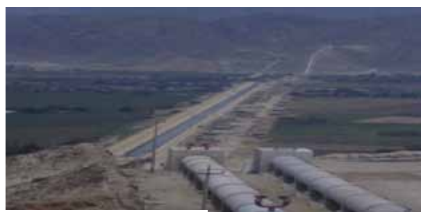
Figura 6 - Canalización del río Santa