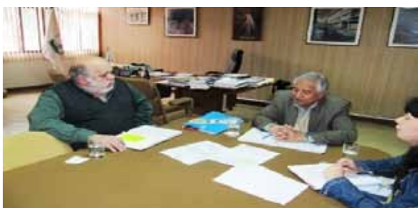
Figura 3 - Tercer trabajo de campo

El cuarto trabajo de campo permitió concluir la primera etapa del cuestionario. Asimismo, se establecieron las pautas para la sostenibilidad de la investigación mediante la organización de talleres de asociatividad en el Valle de Virú.