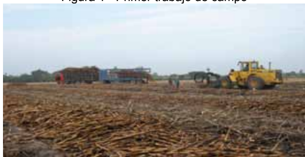
Figura 1 - Primer trabajo de campo

El segundo trabajo de campo tuvo como objetivo la aplicación de las encuestas y las entrevistas para la elaboración de la primera versión del árbol de problemas y el árbol de objetivos.