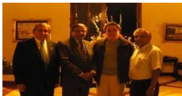
Figura 4 - Cuarto trabajo de campo

Las Figuras 5 y 6 muestran los cultivos en una zona desértica y la canalización de las aguas del río Santa.