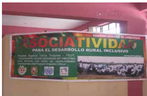
Figura 13 – Presentación del taller

El día 3 de noviembre se realizaron reuniones con los representantes de las instituciones auspiciadoras, visitas a las instalaciones del Proyecto especial Olmos Tinajones y al Fundo experimental Pasabar con dirigentes del Valle Viejo de Olmos (Figura 14).