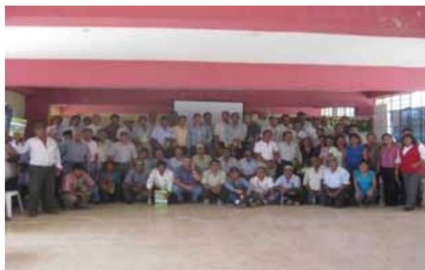
Figura 16 – Charla final

Los talleres, Figura 16, generaron espacios de diálogo entre los actores (sector público, privado y académico) para lograr el desarrollo sostenible a partir del consenso y la construcción de un entorno basado en la equidad y la asociatividad.