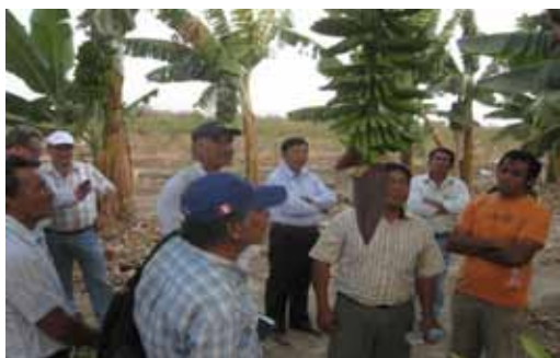
Figura 14 – Visitas a las zonas de cultivo

Estos talleres replicaron las experiencias del taller de asociatividad de Virú con la metodología participativa de la ONUDI (Figura 15). Las conclusiones del taller fueron las siguientes: