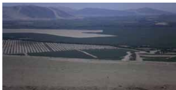
Figura 5 - Zonas de cultivo

Las Figuras 5 y 6 muestran los cultivos en una zona desértica y la canalización de las aguas del río Santa.