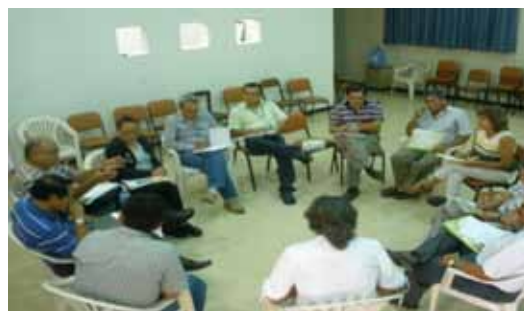
Fuente: elaboración propia (2011)

El 26 de marzo se realizaron visitas a las instalaciones del proyecto especial Chavimochic. La figura 9 muestra su aporte en el desarrollo del recurso hídrico y la Figura 10 muestra el desarrollo agroindustrial de los últimos años.