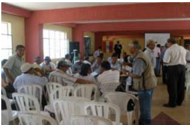
Figura 15 – Taller participativo

Las conclusiones de los talleres concuerdan con el aprovechamiento de las potencialidades de los valles, en función de las variables de segundo orden (DESAGRO, DESHÍDRICO, DESPARQUE, DESNOTRAD y DESPÚBLICO).