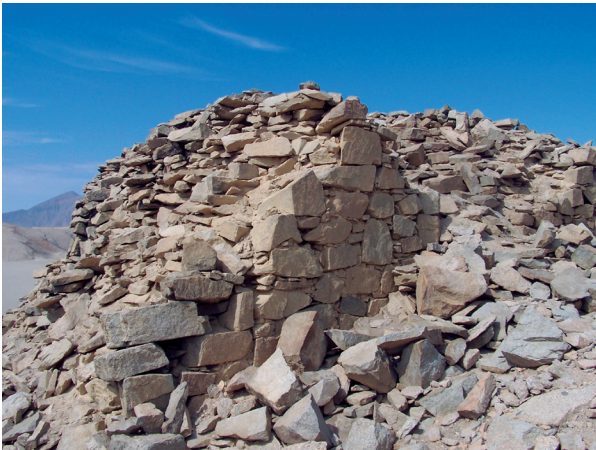
Figura N° 3. Similar a las 13 torres se observa el derrumbe de una torre, posible producto de los sismos.