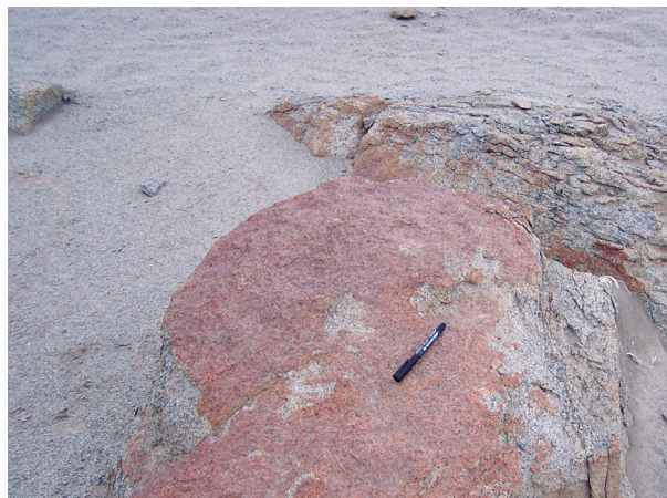
Figura N° 10. Bloque de roca con abundante oxidos de Fe (limonitas), producto de la meteorización química de los ferromagnesianos. Detrás de ella otro bloque afectado por desescamación.