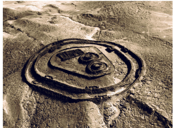
Figura N° 4. Se observa vestigios de surcos de agua dentro del templo fortificado y en su periferia. Por la forma concéntrica de la construcción, es posible que se den empozamientos de agua, producto de la actividad del Fenómeno de El Niño.