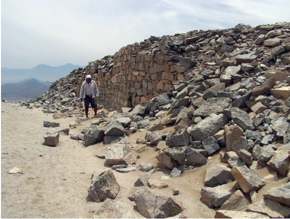
Figura N° 1. Derrumbe de una pared del templo fortificado, al parecer producto de los sismos.