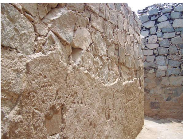
Figura N° 5. El enlucido se conservó en la parte inferior, pero en la parte superior ha desaparecido, probablemente a causa de las lluvias y los sismos.