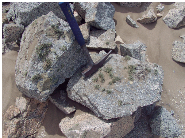
Figura N° 11. Roca atacada por meteorización biológica: los líquenes se alimentan de la roca y la deterioran.