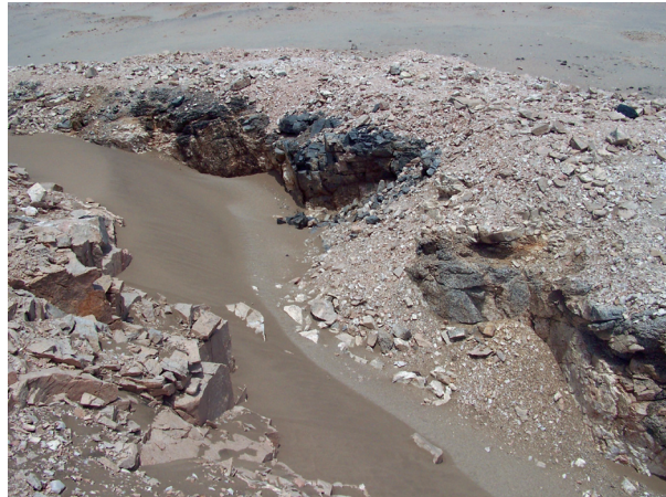
Figura N° 9. Trinchera de explotación de bloques de roca cubierta por material eólico compuesto por arena.