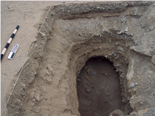
Figura N° 8. Calicata donde se levantó la columna estratigráfica. Muestra sedimentos muy gruesos y finos que evidencian la actividad del Fenomeno de El Niño.