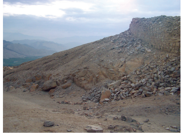
Figura N° 2. La morfología del terreno crea zonas de debilidad en las construcciones y el sismo provoca que las paredes fallen estructuralmente.