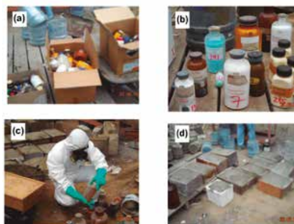
Figura N° 1. Muestra parte del procedimiento seguido:

Se requiere de una baja relación de agua-cemento con suficiente contenido de cemento, compactación adecuada y curado apropiado para producir concreto denso con capilares discontinuos (baja permeabilidad). Dar un acabado al concreto para proporcionar una superficie densa, libre de agujeros y defectos puede mejorar la resistencia a los químicos. Ver Figura N° 1.