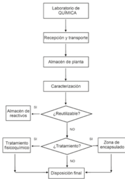
Figura N° 3. Diagrama de flujo del proceso operativo