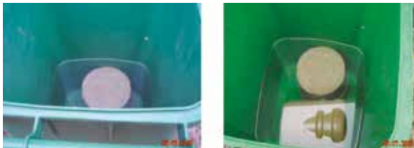
Figura N° 2. Seguimiento y medición.

De los residuos encapsulados para proporcionar la evidencia de la conformidad, se toman muestras según su caracterización y son introducidos en agua de la red dentro de envases plásticos. Luego se toman muestras del agua cada semana y se les toman mediciones de pH y conductividad para realizar las verificaciones de cambios significativos. Si estos valores tuviesen esas variaciones, se harían otras como el DQO y otros específicos, de acuerdo al residuo encapsulado. Ver Figuras N° 2 y 3.