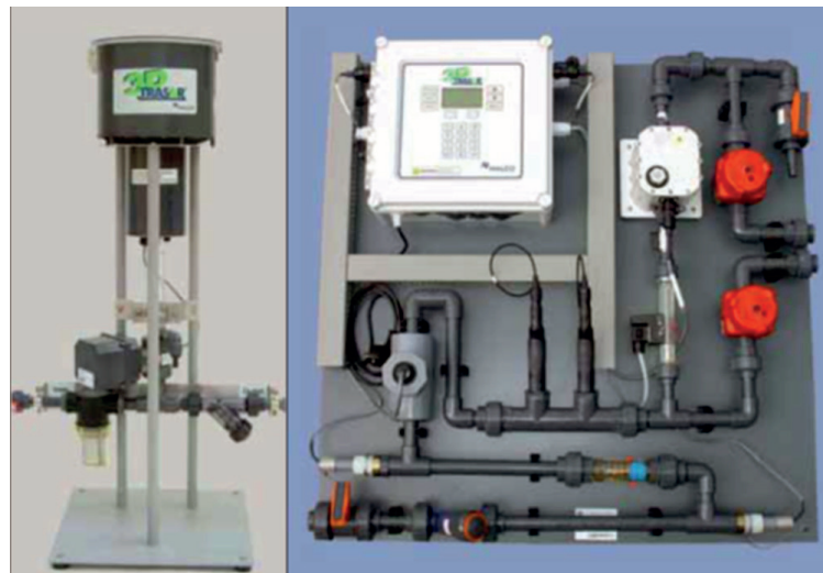
Figura N°2. Funcionamiento del sistema 3D Trasar