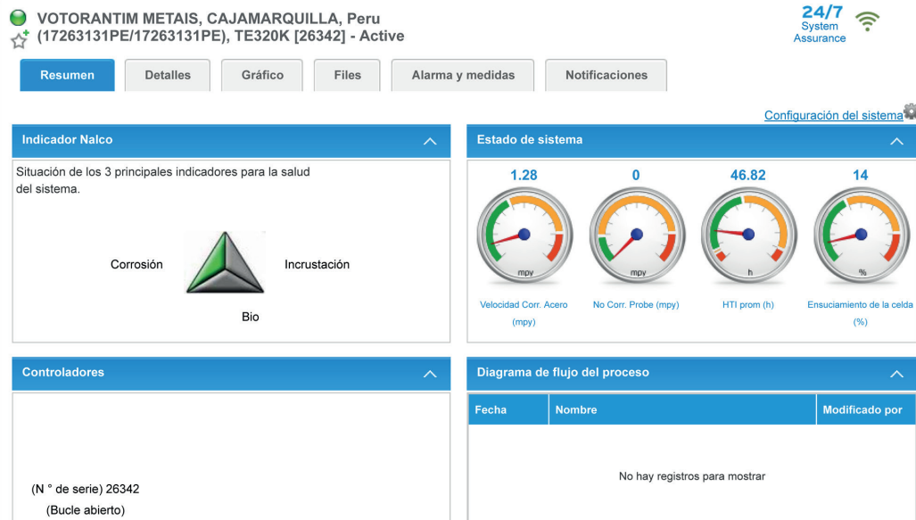
Figura N°1. Detalles del sistema

» Resumen de sistema » Detalles del sistema