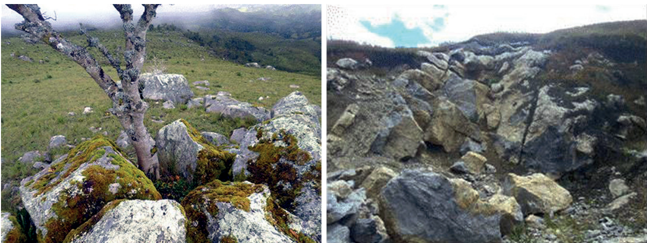
Figura 02. Porosidad secundaria en la cabecera de cuenca del río Jequetepeque