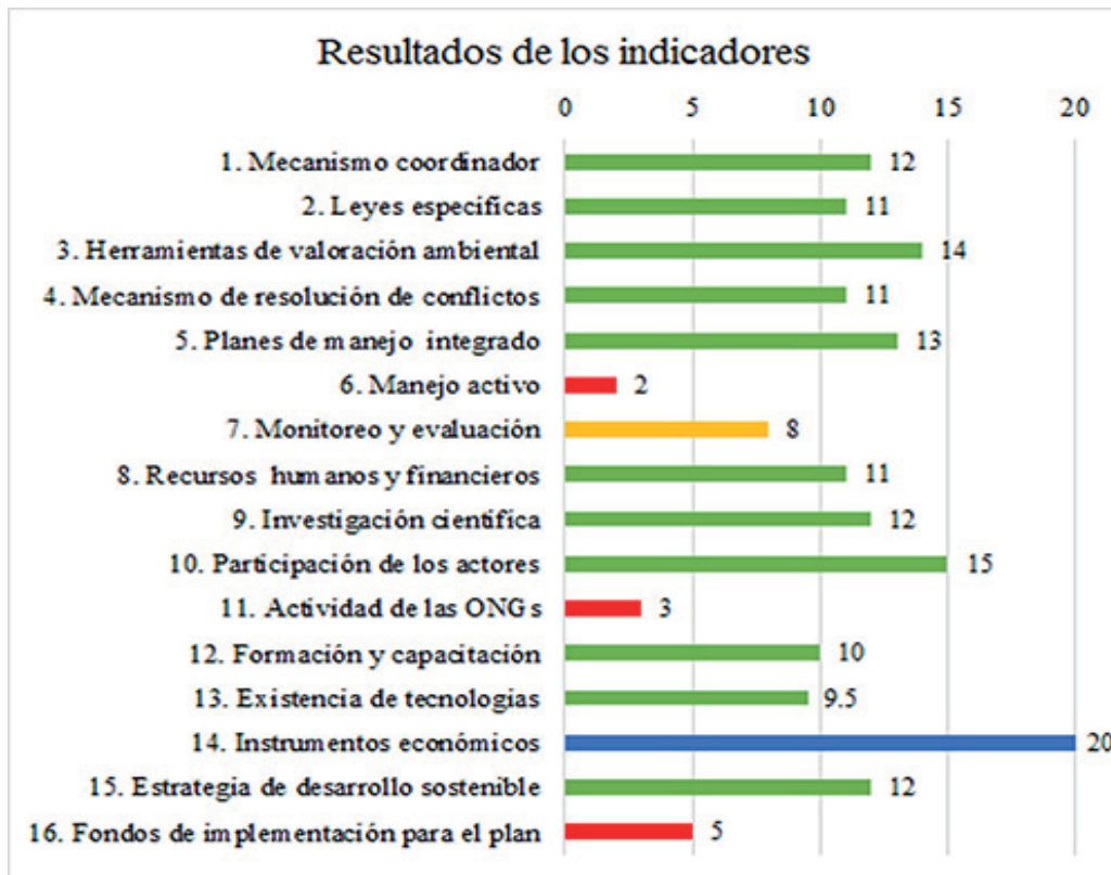
Figura N° 1. Resultados del análisis de los 16 indicadores de gobernanza. Elaboración propia.

once indicadores por debajo de los dieciséis y un indicador con el valor de 20 puntos.