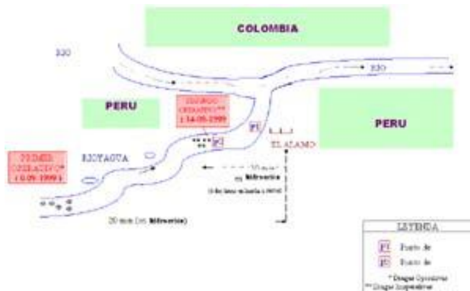
Figura 5 - Croquis de ubicación de puntos de monitoreo