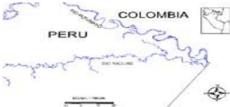
Figura 1- Ubicación del área de estudio

Las principales especies forestales que se observaron en la zona de estudio son: