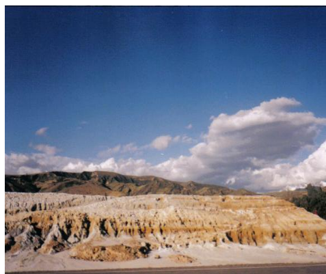
FIGURA Nº 2. VISTA PANORÁMICA DE RELAVERA DE TICAPAMPA

La cancha de relaves presenta varios desniveles a lo largo de su extensión y ha sido depositada en forma paralela al río Santa, en su margen izquierda.