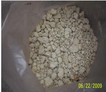
FIGURA N° 4. RELAVE GRUESO DE TICAPAMPA, MALLA +200

Para el relave, se determinó que el tamaño de partícula sería de 100% menos malla 200. Ver Figura N° 4 y 5.