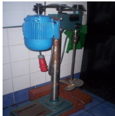
FIGURA N° 3. EQUIPO DE HOMOGENIZADO DE PULPA

Este Equipo de homogenizado de pulpa, se caracteriza por presentar un funcionamiento mecánico-eléctrico, el cual posee diferentes rangos de velocidades, que van desde los 100 rpm hasta 200 rpm. Sin embargo, por requerimientos operativos de condición de laboratorio, el ensayo de homogenizado de la pulpa, se efectuó en la velocidad que van desde los 100 rpm hasta 300 rpm. Ver Figura N° 3.