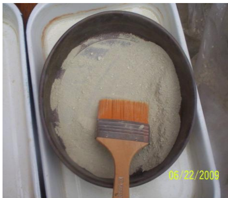
FIGURA N° 5. CLASIFICACIÓN DE RELAVE POLIMETÁLICO DE TICAPAMPA, MALLA -200