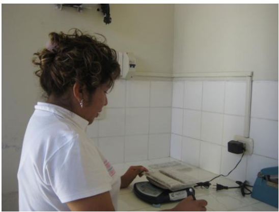
Foto 5 .- Cuantificación de las pilas y baterías para neutralizarlos.

8 de los bancos ecológicos en la Escuela Académico Profesional de Ingeniería de Minas con las pilas