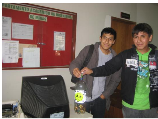
Foto 1 .- Recopilación de pilas y baterías en los contenedores especiales para este propósito los alumnos de la EAPIM participan activamente.

2da Etapa.- En el siguiente paso se realizó el trabajo de encuestas y de sensibilizacion mediante charlas a los alumnos de la EAPIM. respecto a los residuos sólidos peligrosos ( pilas y baterías) y la necesidad de vivir en ambientes limpios y saludables.