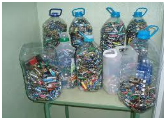
Foto 2 .- Almacenamiento de las pilas y baterías que se recopilaron en la EAPIM las pilas para luego pasar a la estabilizacion.

4ta Etapa.- (foto N°2) Almacenamiento y Cuantificación de los residuos peligrosos de pilas y baterías y luego se llevaran a un lugar de acopio especial para estos residuos peligrosos debido a los metales que contienen.