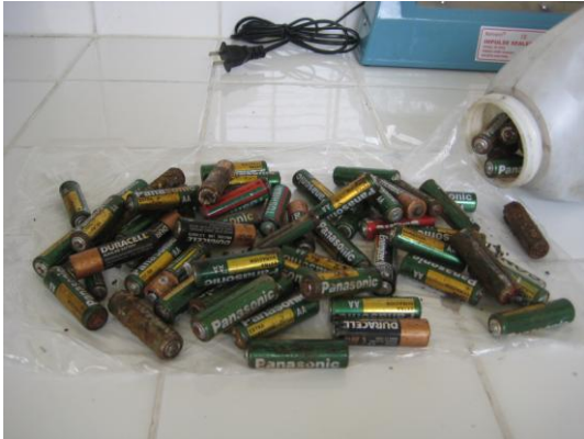
Foto 3.- Las pilas agotadas pasan al proceso de selección y cuantificación, para Neutralizarlos y Estabilizarlos.