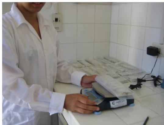
Foto 8 .- Pesada de ladrillos de pilas estabilizadas y neutralizadas, listas para ser confinadas en los bancos.

Estamos contribuyendo en crear una conciencia ambiental acerca de la importancia de no eliminar las pilas y baterías como un residuo común, sino que se deben colocar en recipientes adecuados y simples de material reciclado con la finalidad de no causar impactos ambientales negativos