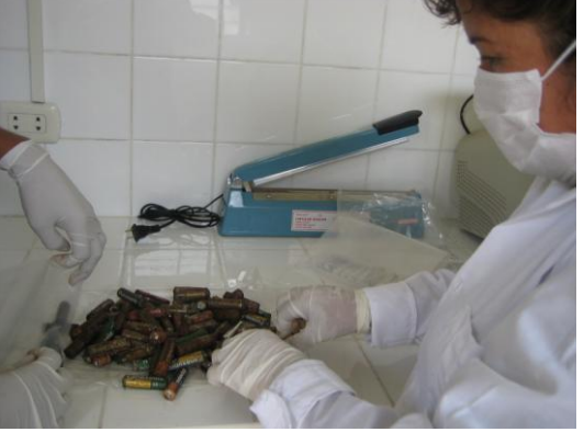
Foto 4 .- Clasificación y Almacenamiento de las pilas y baterías que se recopilaron en la EAPIM