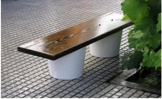
Foto 6 .- Bancos ecológicos donde están confinadas las pilas secas previamente estabilizadas y neutralizadas.

y baterías que se recogieron previamente. (foto N°6)