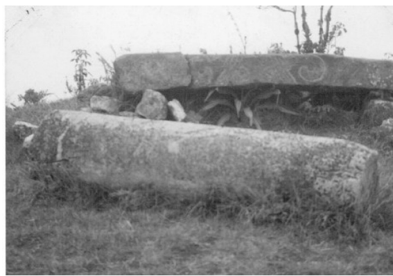
Fotografía 2. Dintel y columna de la tercera plataforma. Fuente: Daniel Morales. 1996.