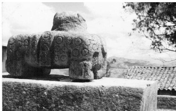
Fotografía 4. Monolito de felino-jaguar de la segunda plataforma.