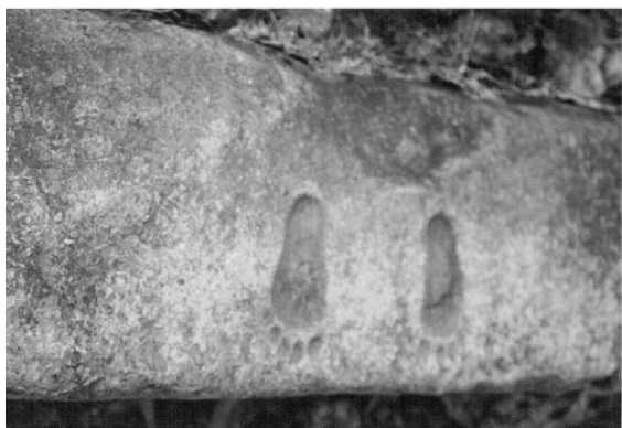
Fotografía 5. La piedra del rastro o de los pies tallados. 1996.