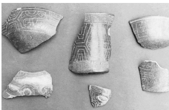
Fotografía 8. Cerámica de Pacopampa.