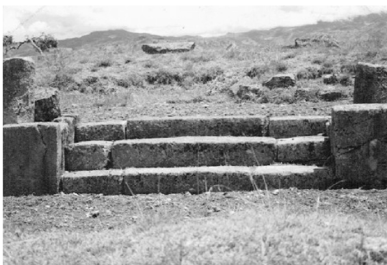
Fotografía 6. Escalinatas de la plaza hundida de la tercera plataforma. Fuente: Daniel Morales. 1996.