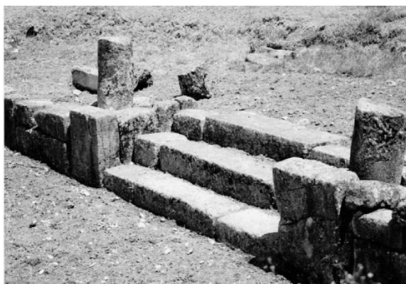
Fotografía 1. Escalinatas con columnas de la tercera plataforma. 1996.