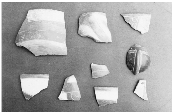
Fotografía 7. Cerámica de Pacopampa.