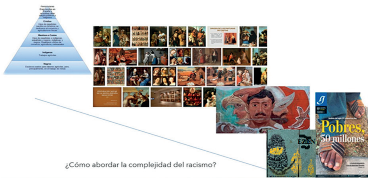
Figura 1 El racismo en México

Nota. Imágenes de Internet, Museo de las Intervenciones, mestizaje, EZLN, Gaceta UNAM