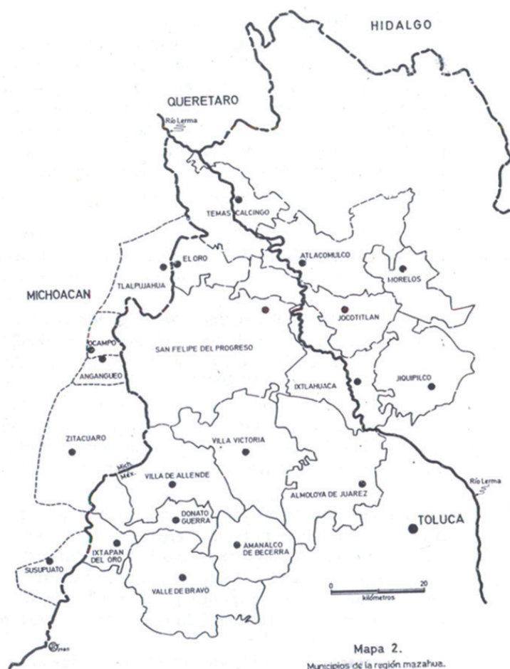
Figura 1 Mapa de los pueblos mazahuas