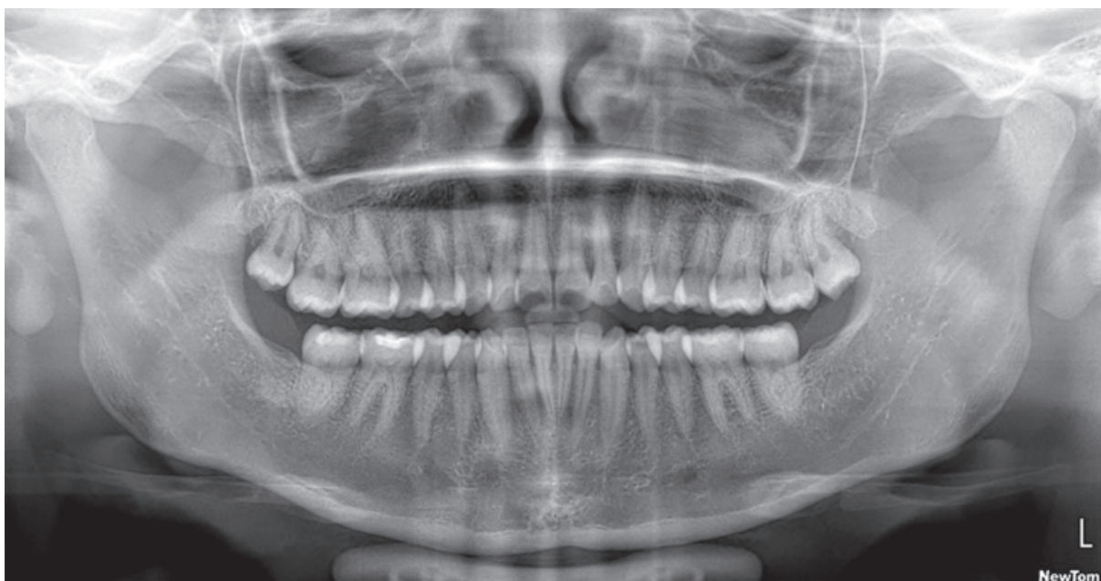
Figura 2. Ortopantomografía. No se observa evidencia de lesiones o alguna otra alteración ósea