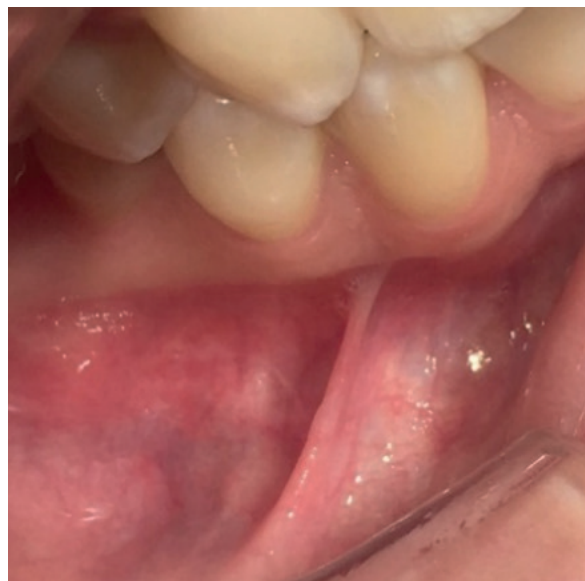
Figura 1. Foto intraoral de la lesión

Debido a las características clínicas y la proximidad de la lesión con la emergencia del nervio mentoniano se sospe-