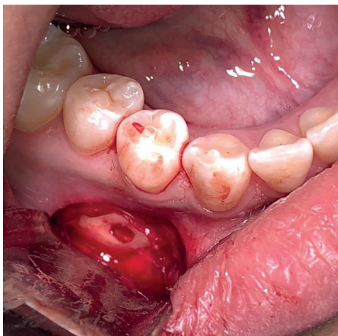
Figura 4. Lecho quirúrgico