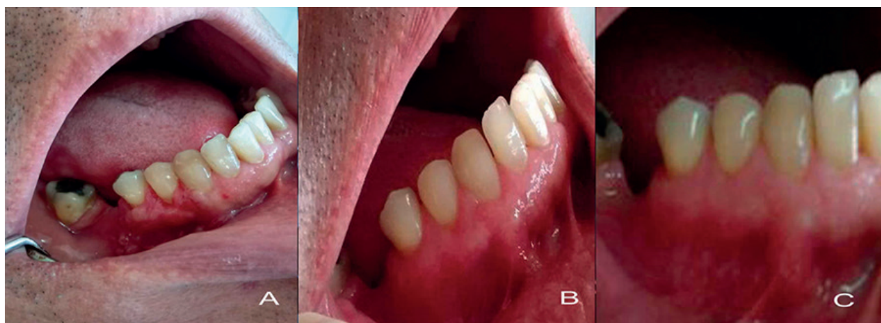
Figura 3. Evolución clínica del área receptora: A. A los 15 días, B. A los 6 meses y C. A los 2 años