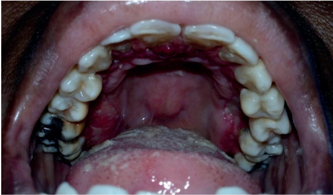
Figura 3. Eritema lineal a nivel de encía marginal y papilar de maxilar superior