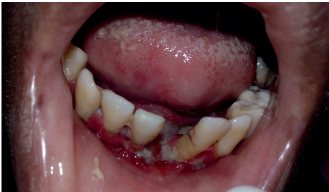
Figura 2. Eritema lineal a nivel de encía marginal y papilar de maxilar inferior

Diagnóstico. Se evaluó a la paciente en la junta médica multidisciplinaria conformada por: dermatología, medicina interna, cirugía general, oftalmología, estomatología, cirugía oral y maxilofacial, en la que se decidió realizar prueba de Mantoux para descartar tuberculosis, la cual resultó negativa. Exámenes de laboratorio paraclínicos, en los cuales se evidenció disminución de los linfocitos, eritrocitos y hemoglobina, VDRL no reactivo, VIH negativo, Hepatitis B y C negativos, ionogra-