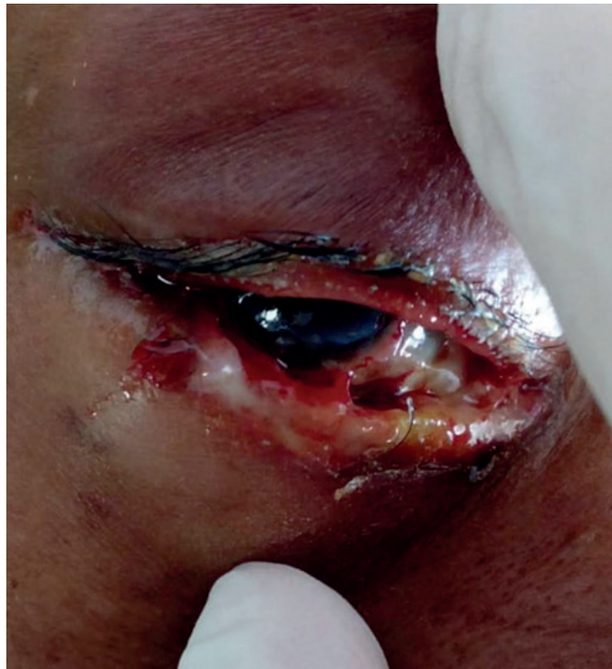
Figura 1. Ojo derecho con presencia de úlcera con secreción hemopurulenta