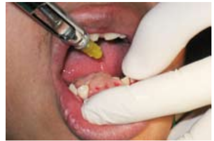
Figura N.º 6. Elevación de lesión.