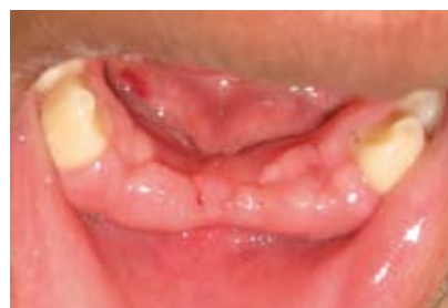
Figuras N.º 13 y 14. Vista a las dos semanas de la operación.