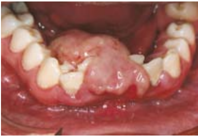
Figura N.º 4. Lesión.