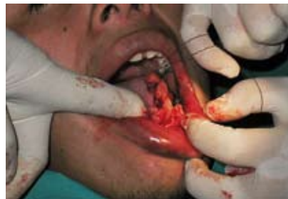
Figura N.º 8. Sutura.