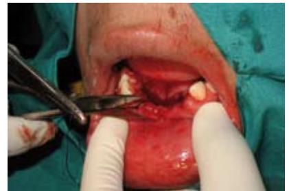
Figura N.º 9. Sutura.