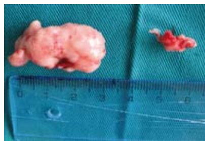
Figura N.º 11. Aspecto macroscópico.