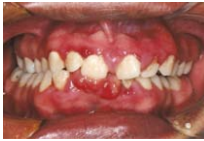
Figura N.º 2. Vista frontal.