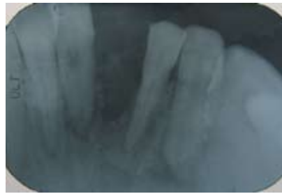
Figura N.º 5. Radiografía.