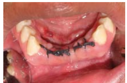
Fig. N.º 12. Control de sutura.