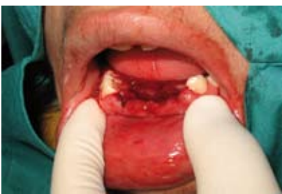
Figura N.º 10. Zona anterior.