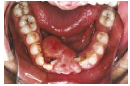
Figura N.º 3. Vista oclusal.