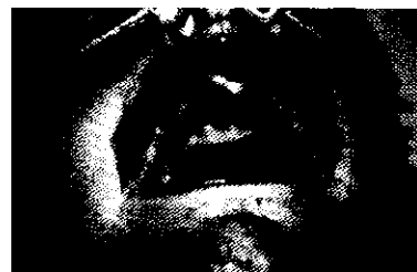
Fig.4: Injerto de peroné en maxilar