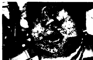
Fig.2: Emergencia B