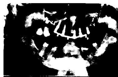
Fig. 8: Radiografía Panorámica