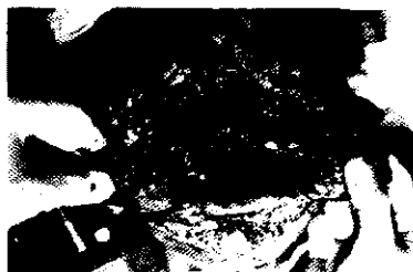
Fig. 1: Emergencia A

Esto requiere un planeamiento y un equipo multidisciplinario, incluyendo cirujanos con experiencia microquirúrgica y prostodóntica 6 .