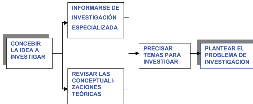
Figura 1. Acciones previas al planteamiento del problema de investigación.