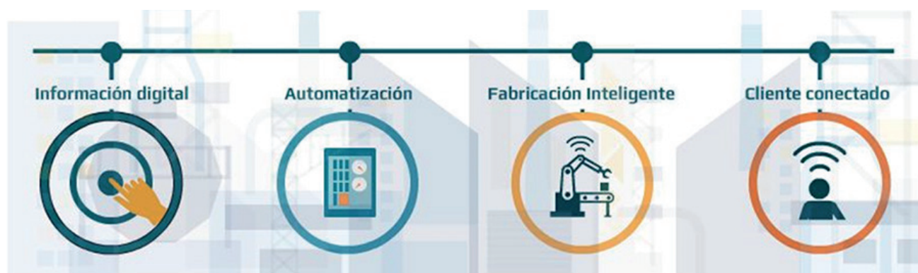
Figura 1. Impulsores de la digitalización industrial

En la figura 1, se aprecia cuatro avances que se constituyen en impulsores que favorecen la transformación digital industrial. La data recogida en el mundo físico se procesa, analiza y almacena digitalmente, convirtiéndose en información digital. Las labores manuales y repetitivas se sustituyen por sistemas autónomos, simplificados y automáticos. Las etapas de preproducción, producción y posproducción se sincronizan en un flujo integrado inteligente que permite productividad mayor, sostenibilidad y rentabilidad. Un ente importantísimo, el cliente, se presenta activamente informado y conectado con el producto y genera más oportunidades de negocio.