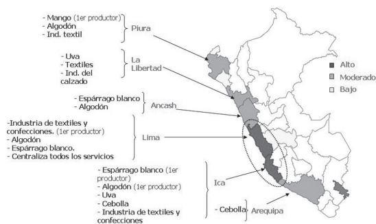
Exportaciones: Regiones más beneficiadas