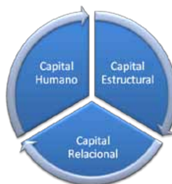
Figura N° 1 Estructura del Capital Intelectual

Conformada por las relaciones que aportan valor a la empresa, como la agenda de clientes, proveedores, accionistas, bancos, acuerdos, alianzas estratégicas, imagen de la empresa, entre otros (Bontis, 1998)