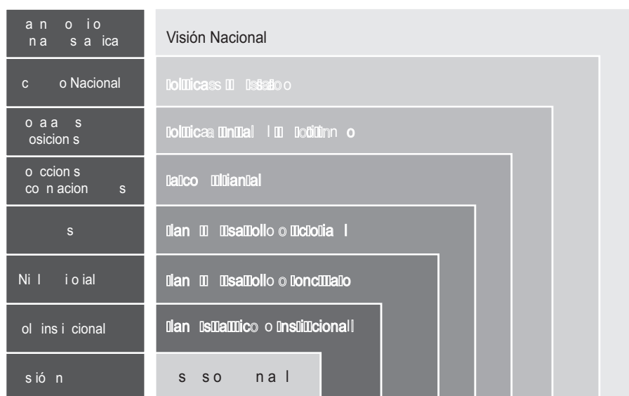
Ilustración N.º 1. Visión integral del sistema de planeamiento.

De seguirse de acuerdo a esta visión, el presupuesto se convierte en un instrumento básico en la obtención de los objetivos nacionales.